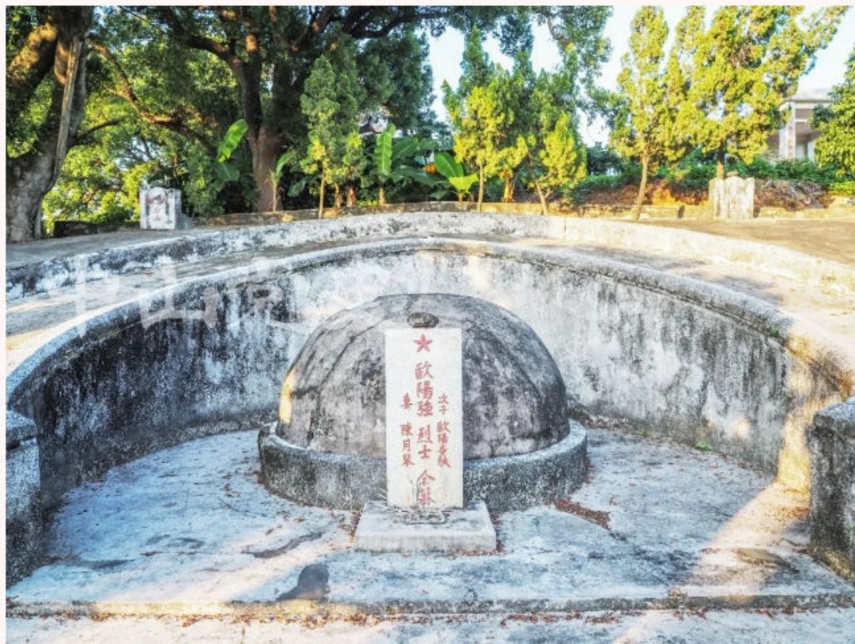
▲欧阳强烈士墓近景

1936年，粤汉铁路竣工通车。全国铁路总工会华北工作委员会决定派欧阳强到广东工作。之后，欧阳强前往乐昌车站工作，秘密负责领导乐昌地区人民的革命斗争。1938年10月，欧阳强任湖南郴县地区党支部书记。1945年抗战胜利后，欧阳强在乐昌建立“铁型俱乐部”，继续从事工运斗争。1946年初，欧阳强被国民党第二次逮捕，后虽经工友声援出狱，却被铁路当局开除了。为了革命的胜利，欧阳强以卖药为掩护，从湖南的郴州到广东乐昌、韶关、广州沿线，继续为党做宣传、组织工作。1947年10月9日晚，一群国民党便衣特务逮捕了欧阳强。在狱中，他坚贞不屈，不为利诱所动，经受严刑拷打亦无所畏惧。1948年4月26日下午，在广东乐昌枇杷岭山下的一片松林旁，国民党反动派杀害了欧阳强，其牺牲时54岁。