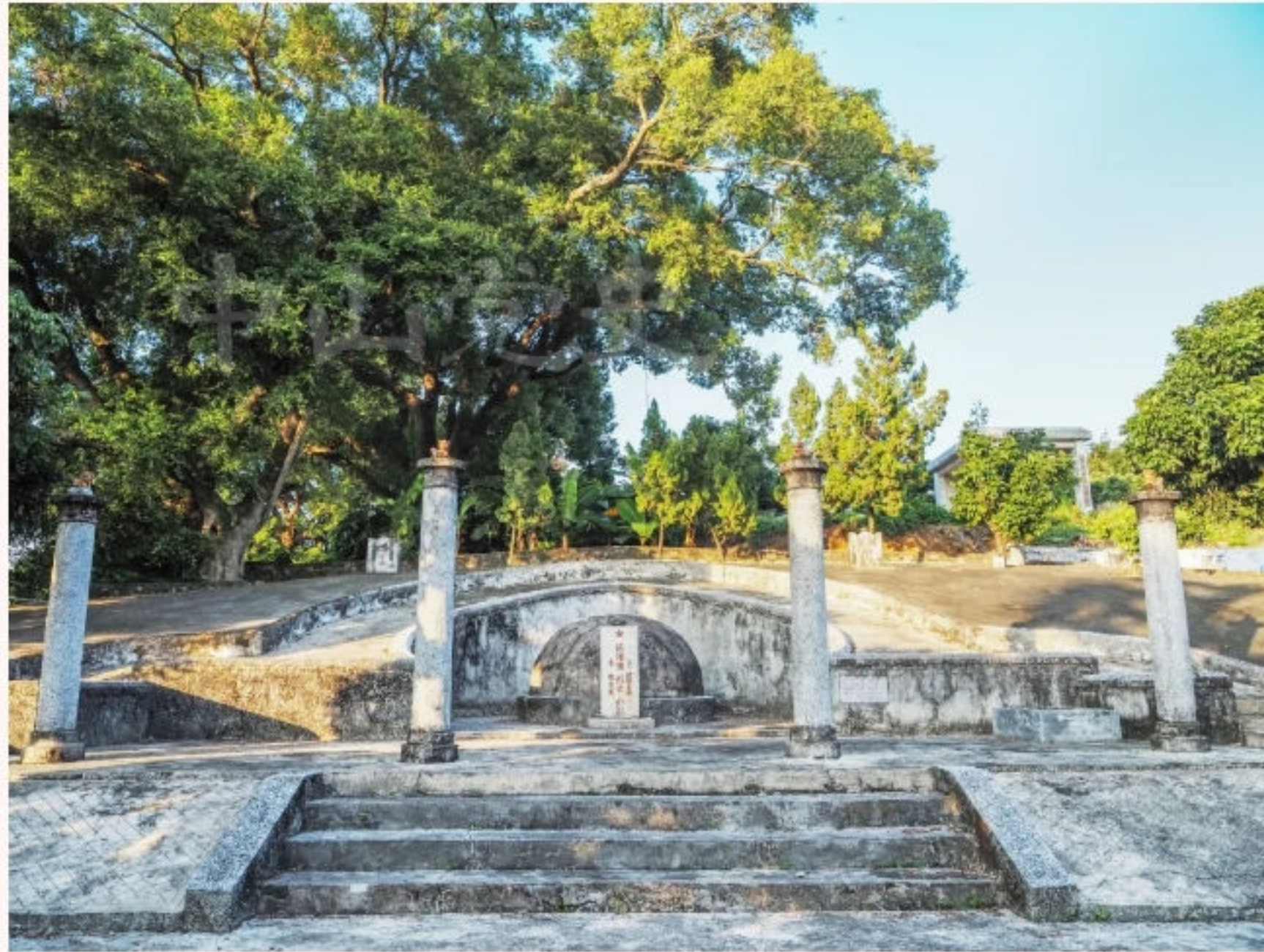
▲欧阳强烈士墓全景（黄春华 摄于2020年10月）

欧阳强（1894—1948），生于中山南朗麻子村的一个归国华侨家庭。1913年，他来到唐山，在机车车辆厂当徒工。1922年10月13日，欧阳强参加唐山机车车辆厂3000多名工人举行的大罢工，罢工取得了胜利。1923年1月，欧阳强经邓培等人介绍，加入中国共产党。1925年，欧阳强被调到锦州地区沟帮子机务段机车修理厂当钳工。很快，他就和地下党员李华灿、李加晓、冯昌等人取得联系，建立了沟帮子党支部，任支部书记。1928年，欧阳强率领沟帮子70多名铁路工人包围铁路机关“公事房”，向铁路当局提出增加工资等要求，迫使反动当局给工人增加了工资。1929年底，铁路当局对北宁路各站停发年终“花红”，工人生活十分艰苦。1930年1月初，在中共满洲省委的领导下，欧阳强带领沟帮子100多名铁路工人发动争“花红”斗争并取得胜利。1930年初，为加强营沟线营口车站的工作，中共满洲省委派欧阳强到营口机务段工作，并担任营口特支书记。在欧阳强的主持下，营口特支发动工人集资建立了一所“工余学校”。同时，特支又把营口工会组织恢复起来，发展会员七八十人，成为坚强有力的战斗集体。