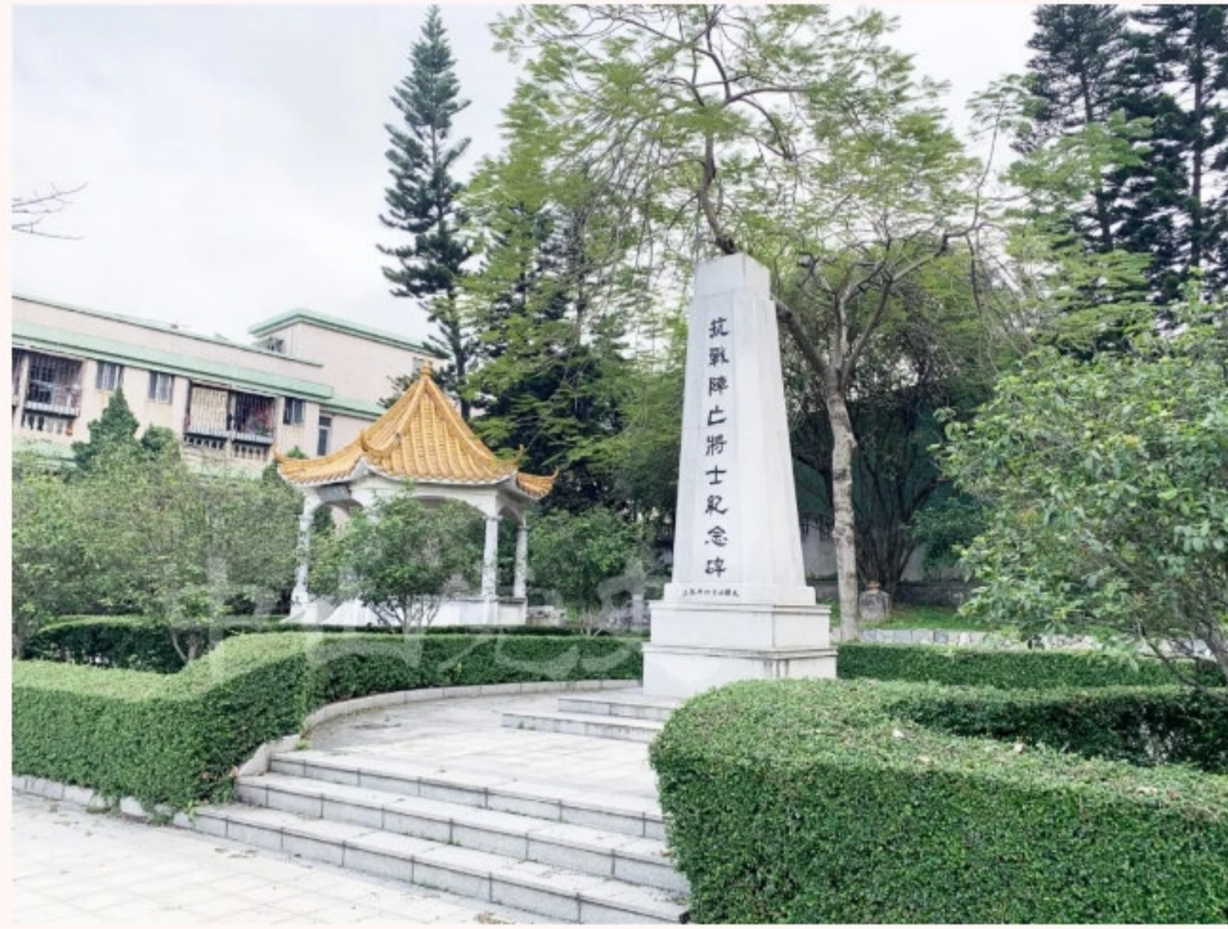
▲抗战阵亡将士纪念碑侧面（《中山日报》记者 摄于2020年3月）

1939年7月24日至9月20日，中山军民在中山县横门沿岸两次击退日军的进犯。中山人民同仇敌忾，国共两党合力抗击来犯之敌，取得两次横门保卫战大捷，大大鼓舞了中山人民抗日的斗志和信心，拉开了中山抗日武装斗争的序幕。为纪念在战斗中阵亡的将士，中山县政府于1947年修建抗战阵亡将士纪念碑，以志中山守军英勇抗击日本侵略者的光辉事迹。