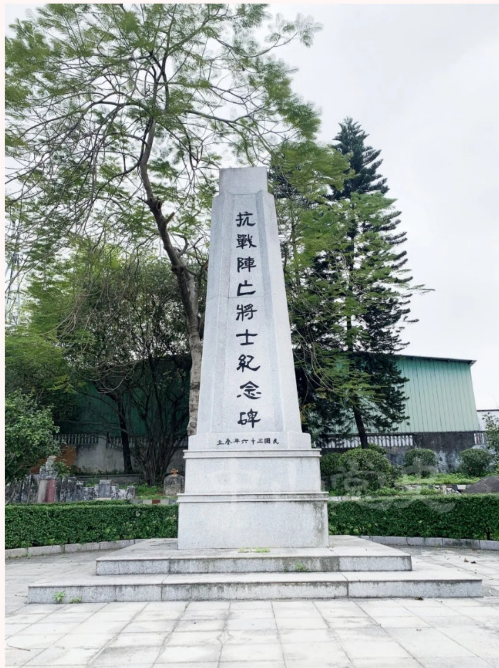
▲抗战阵亡将士纪念碑正面

该纪念碑建于1947年，坐东向西，建筑占地面积约55平方米。碑体由青砖砌成，外表覆盖石灰、灰砂，高约4.5米。碑体正面阴刻隶书“抗战阵亡将士纪念碑”和“民国三十六年春立”等字样。基座为两级台阶，平面呈正方形，底层边长为3.3米。