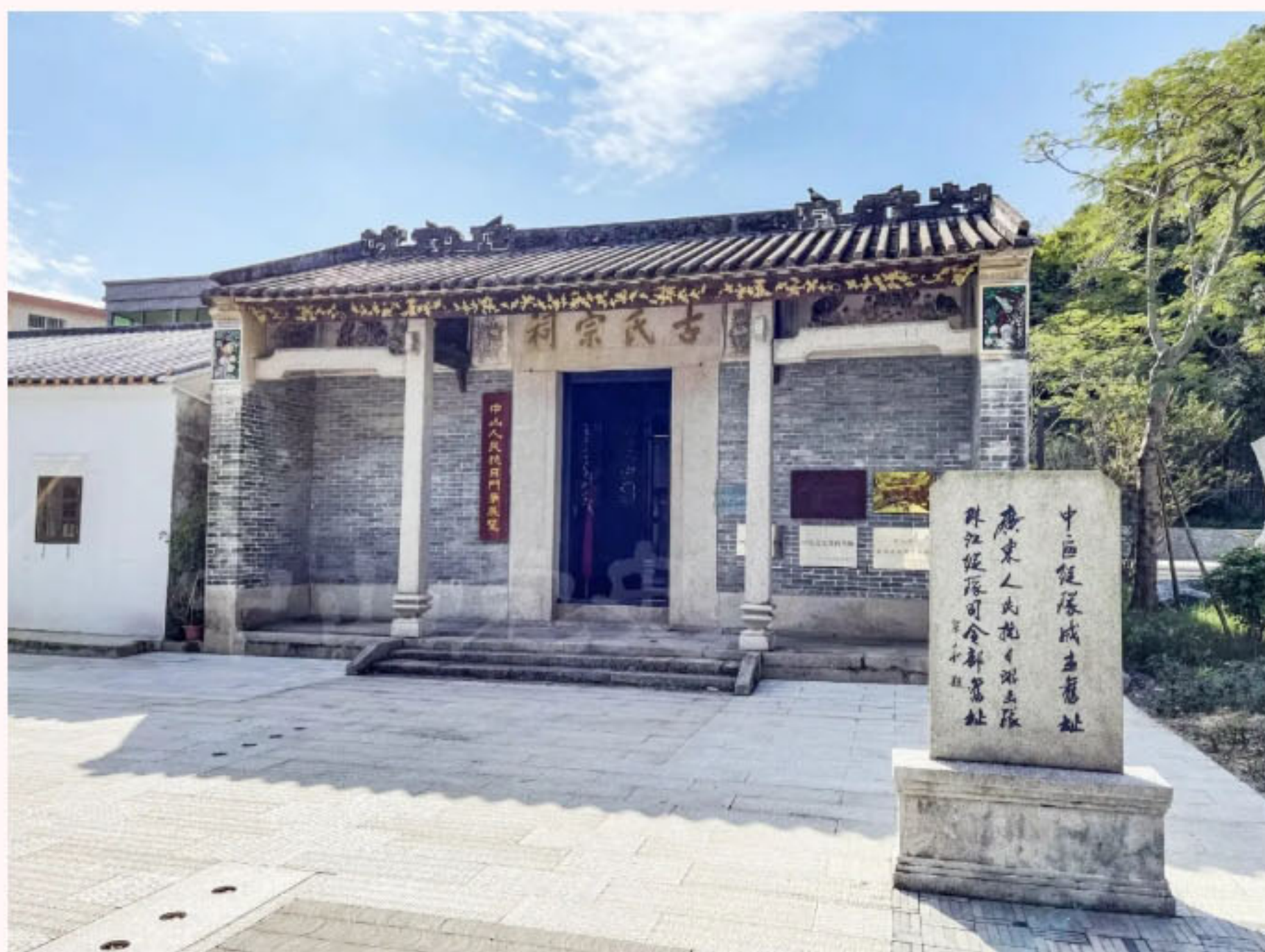
广东人民抗日游击队珠江纵队司令部旧址

1945年1月15日，中国共产党在珠江三角洲敌后建立的人民抗日武装——广东人民抗日游击队珠江纵队在中山发表成立宣言，庄严宣告“珠江纵队是珠江三角洲人民的子弟兵”“热诚接受与拥护中国共产党的领导”“为解放华南同胞而奋斗”。