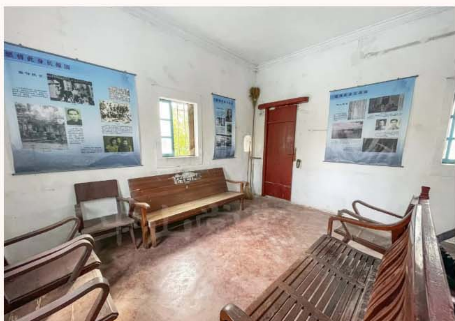
▲白鸽队队部旧址内展览一角

该旧址于2012年1月被中山市人民政府核定公布为中山市不可移动文物；2008年6月被中共中山市委核定公布为中山市革命遗址，并作为中共中山市委党史教育基地。