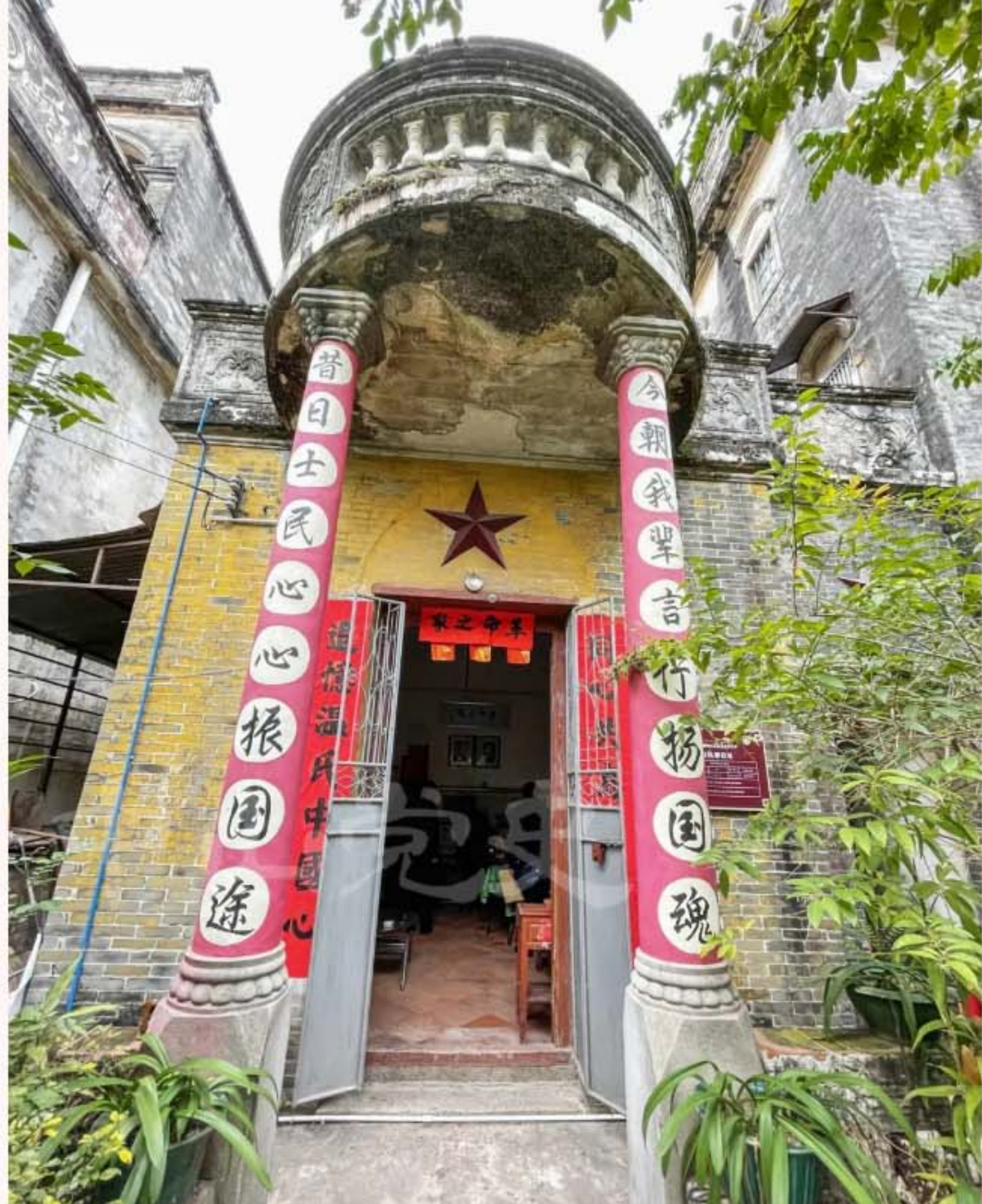
▲白鸽队队部旧址碉楼门口外景

该旧址建于20世纪初，房主原为旅旧金山葛伦埠华侨温守仪。该建筑由楼房、碉楼与庭院组成，是典型的珠江三角洲地区中西合璧风格的碉楼建筑。主建筑有两座：南侧建筑物为“一层半”砖混结构楼房，坐西向东，西半部分为2层，东半部分为1层；北侧建筑物为3层砖混结构碉楼，坐北向南，楼顶有3米×2.5米小楼。此外，西北侧建有单层浴室和厕所。整个院宅分布面积约189平方米，院落面积约115平方米。该建筑保存完好，内部设有“愿将此身长报国”展览，建筑楼后面建有红色党建阵地。