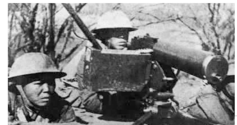
中国守军在台儿庄外围阻击进犯的日军。

抗日战争初期中国军队和日本侵略军在山东南部台儿庄(今属枣庄市)地区进行的一次会战。日本侵略军1937年12月13日和27日相继占领南京、济南后, 为了迅速实现灭亡中国的侵略计划, 连贯南北战场, 决定以南京、济南为基地, 从南北两端沿津浦铁路夹击徐州。台儿庄是徐州的门户, 它位于徐州东北30公里的大运河北岸, 临城至赵墩的铁路支线上, 北连津浦路, 南接陇海线, 扼守运河的咽喉, 是日军夹击徐州的首争之地。1938年3月23日, 日军濰谷支队主力沿台儿庄支线上, 北连津浦路, 南接陇海线, 扼守运河的咽喉, 是日军夹击徐州的首争之地。1938年3月23日, 日军濰谷支队主力沿台儿庄支线上, 北连津浦路, 南接陇海线, 扼守运河的咽喉, 是日军夹击徐州的首争之地。1938年3月23日, 日军濰谷支队主力沿台儿庄支线上, 北连津浦路, 南接陇海线, 扼守运河的咽喉, 是日军夹击徐州的首争之地。1938年3月23日, 日军濰谷支队主力沿台儿庄支线上, 北连津浦路, 南接陇海线, 扼守运河的咽喉, 是日军夹击徐州的首争之地。