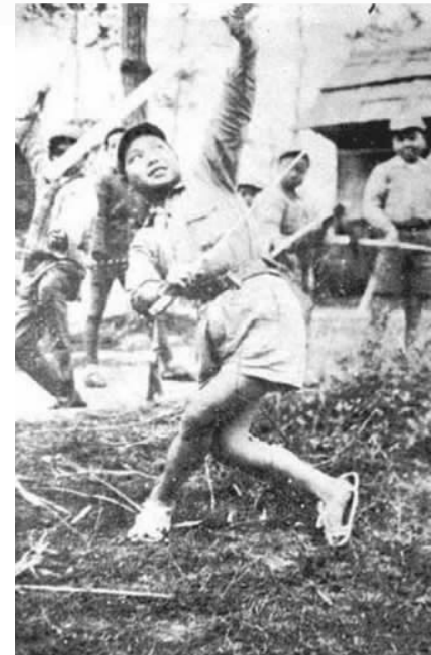
广东儿童教养院粤剧团的儿童在练功。

1938年初,卓教官在我们少年团员当中挑选表现积极的参加少年模范团。入选者将入营训练3个月。我和姐姐都被选中。穿上蓝色军装,我们感到无比自豪。父亲特别支持我俩参加模范团。在少年模范团的日子,生活、学习均实行军事化管理,每天训练、学习、夜行军,生活紧张而有序。每人配发一支木制假枪练习打仗,经常唱少年模范团的团歌。