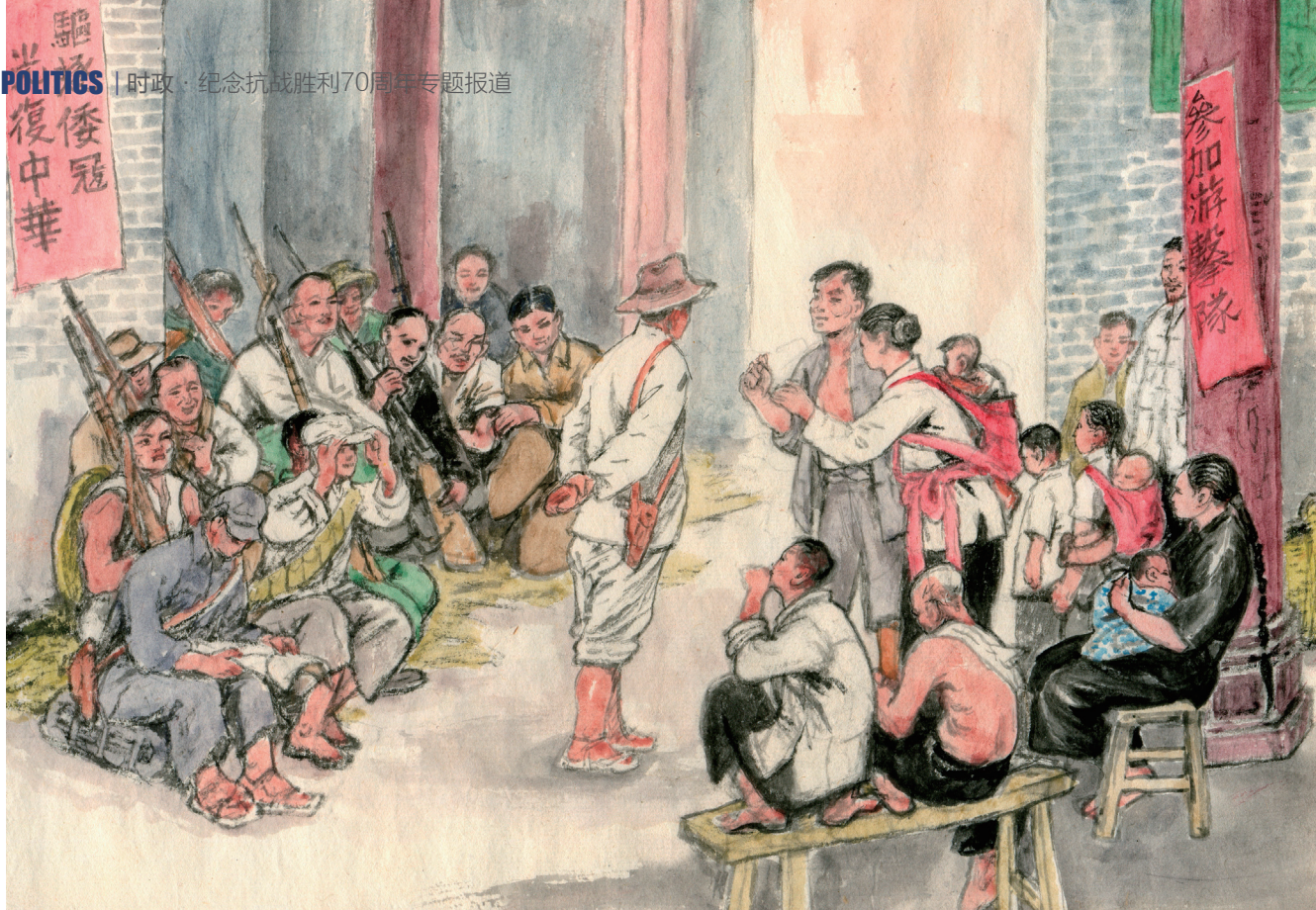
民众争先报名参加游击队 (绘画 / 邓振玲)