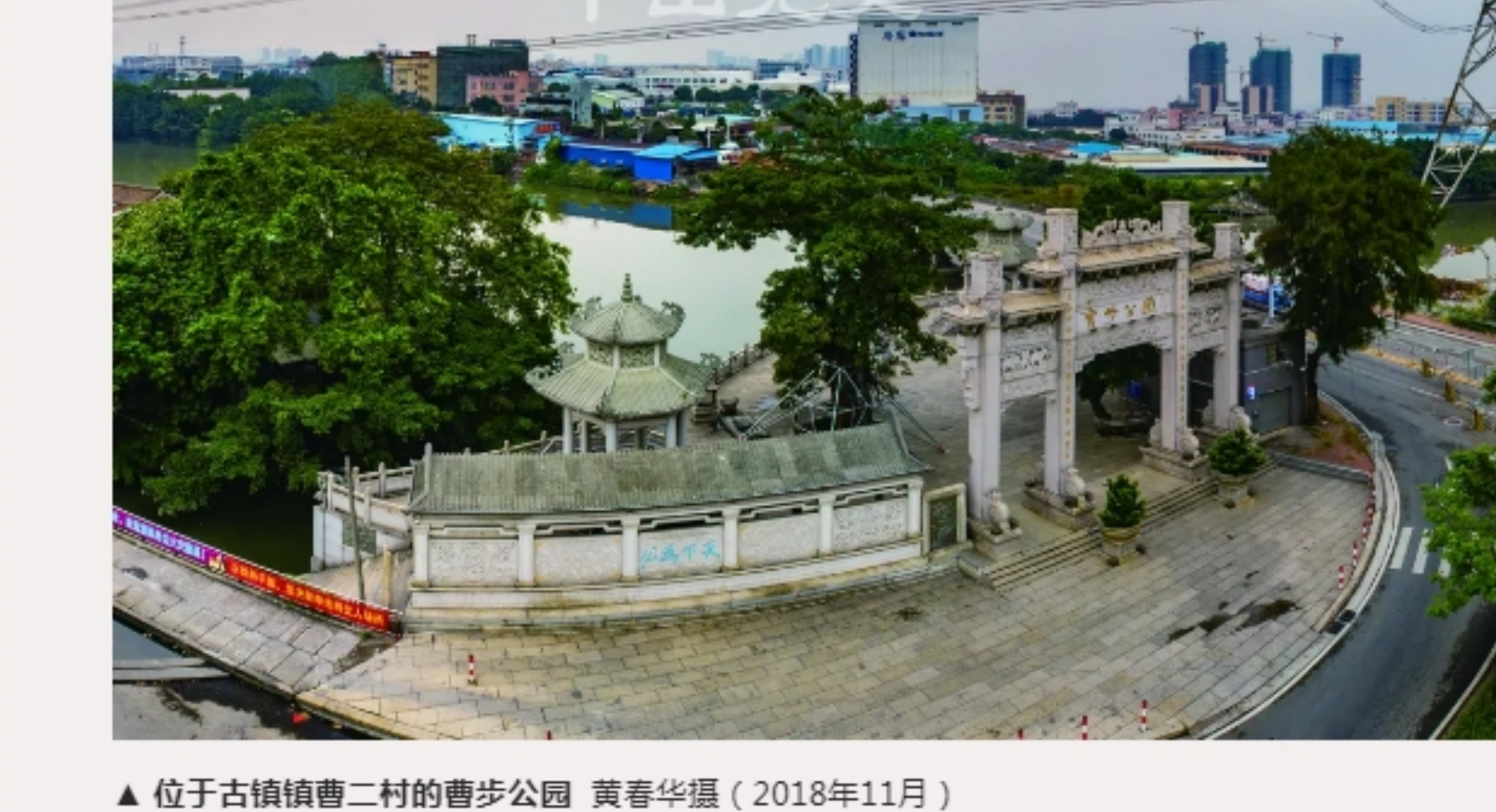
▲位于古镇镇曹二村的曹步公园（2018年11月）