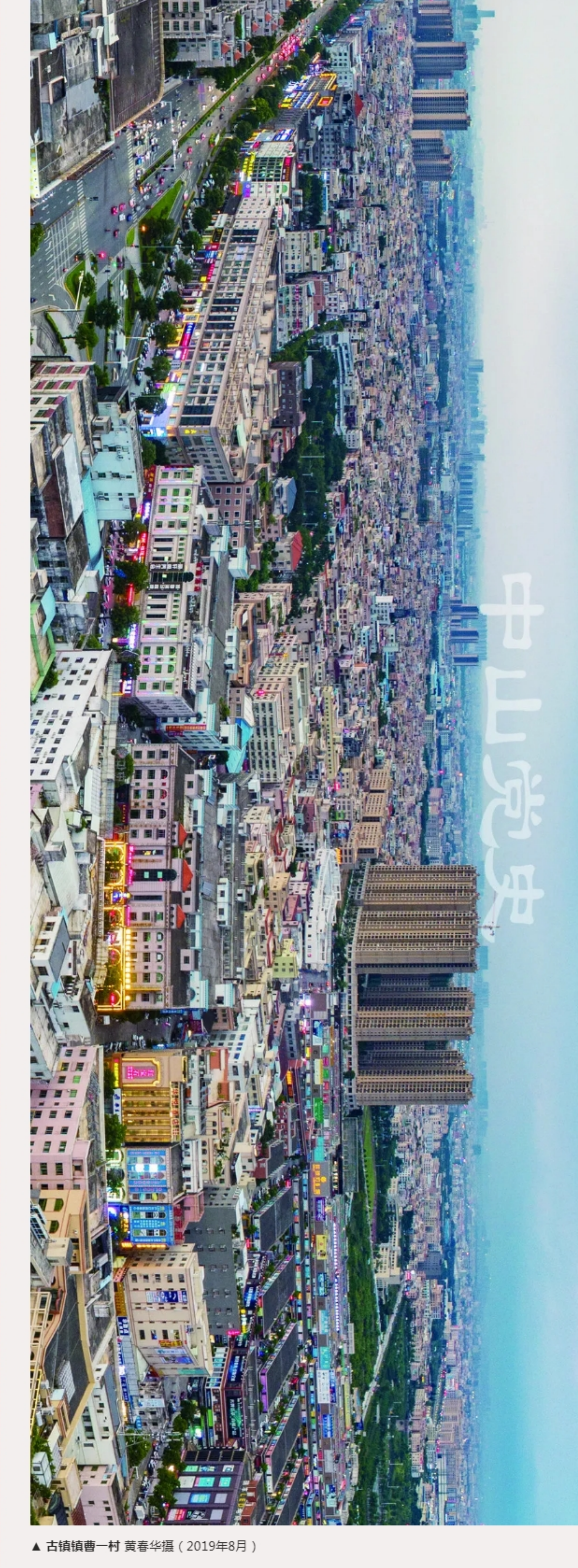
▲古镇镇曹一村（2019年8月）