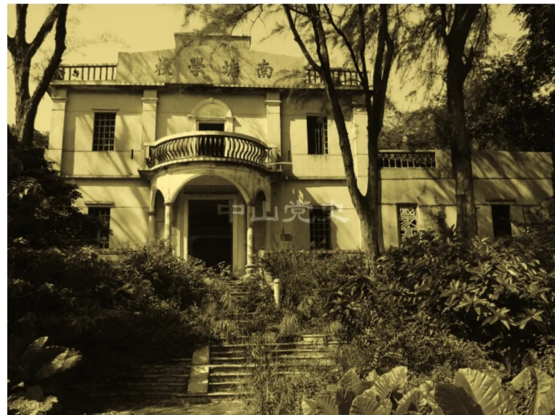
滨海区政务委员会旧址

五桂山各乡都选出群众拥戴和富有工作经验的中共党员或爱国人士当乡长。在此基础上，各个乡通过群众酝酿和民主选举，选出参加区民主政权代表大会的代表，然后在联乡办事处或区民主政权筹委会主持下，召开区一级的民主政权代表大会，并按民主集中制和“三三制”的原则，选出本区的政务委员会，即区一级的民主政权。同年，五桂山、谷镇、滨海三个区的联乡办事处或民主政权筹委会先后成立，积极筹备召开各界人民代表大会。