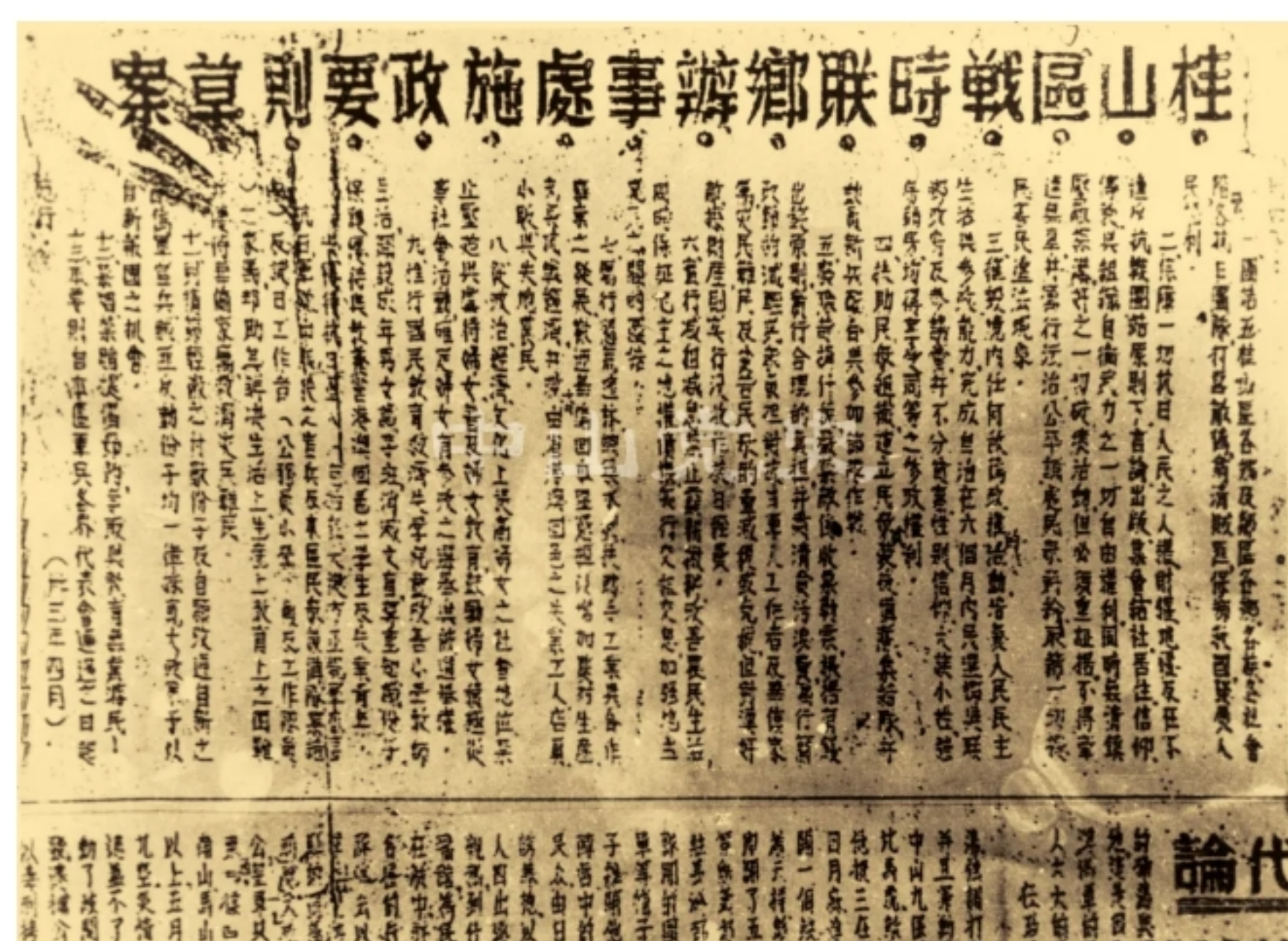
五桂山区抗日民主政权文献

1944年2月，南番中顺游击区指挥部从刚结束的根据地整风学习中抽调人员，成立五桂山根据地民主政权筹备处，并派出两支民主建政工作队，深入五桂山、滨海、谷镇等地农村，宣传民主建政的方针、政策。建政工作队每到一个乡都慎重地开展调查工作，物色人员，召开爱国人士、开明士绅和抗日群众代表座谈会，反复民主协商，充分酝酿。经过两个多月的宣传发动及民主协商，根据地按照民主集中制和“三三制”（即共产党员、各抗日党派成员和群众代表各占三分之一）的原则，按照群众民主选举的方法，选举成立乡政委员会，相继成立了合水口、白企、贝头里、长江、石门、石莹桥、灯笼坑等民主乡政权。