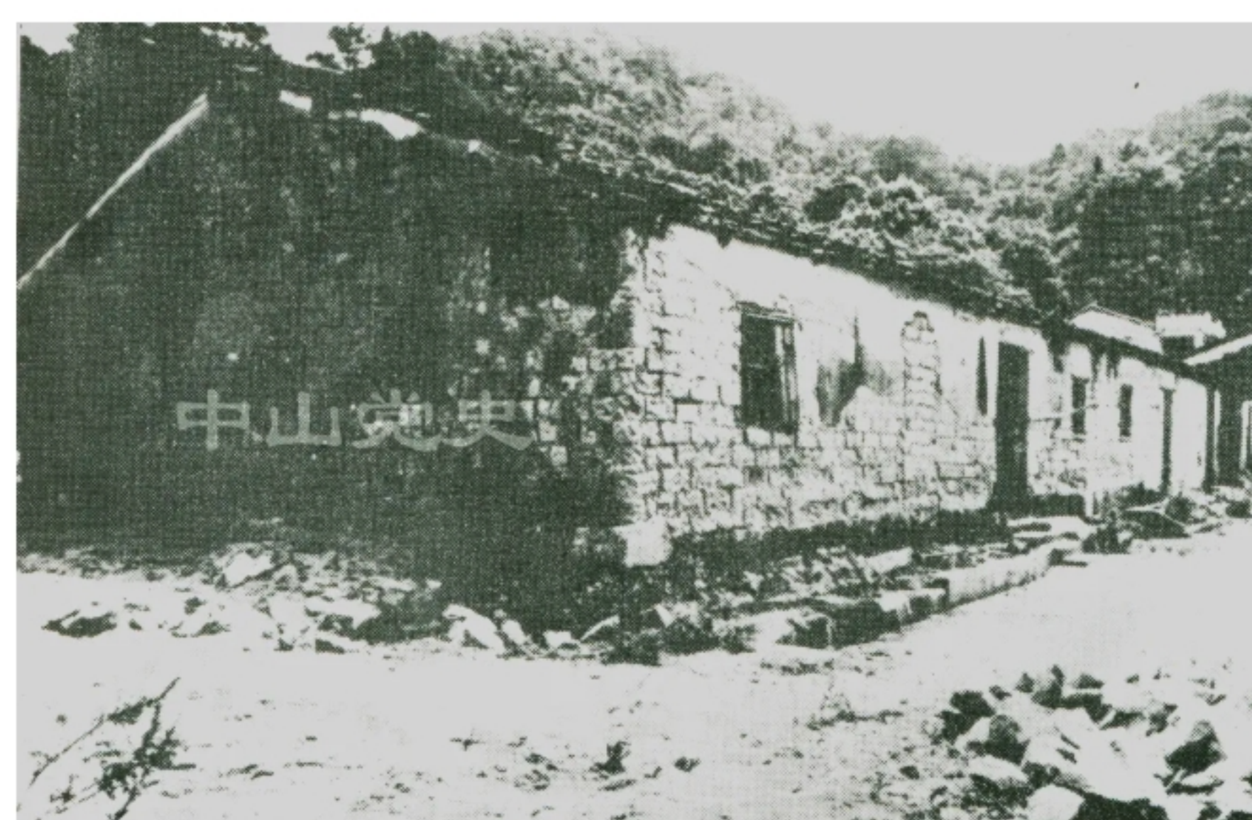
五桂山区抗日民主政权联乡办事处旧址

中山乃至珠江地区的抗日力量不断发展和扩大，需要有巩固的根据地作依靠，也需要有自己的政权去做地方工作，以组织和团结依靠群众，抗日保家，同时解决部队的给养、医疗和兵员的补充问题。在此形势下，中共领导的南番中顺游击区指挥部决定以五桂山区为珠江三角洲地区抗日民主政权建设的先行点。