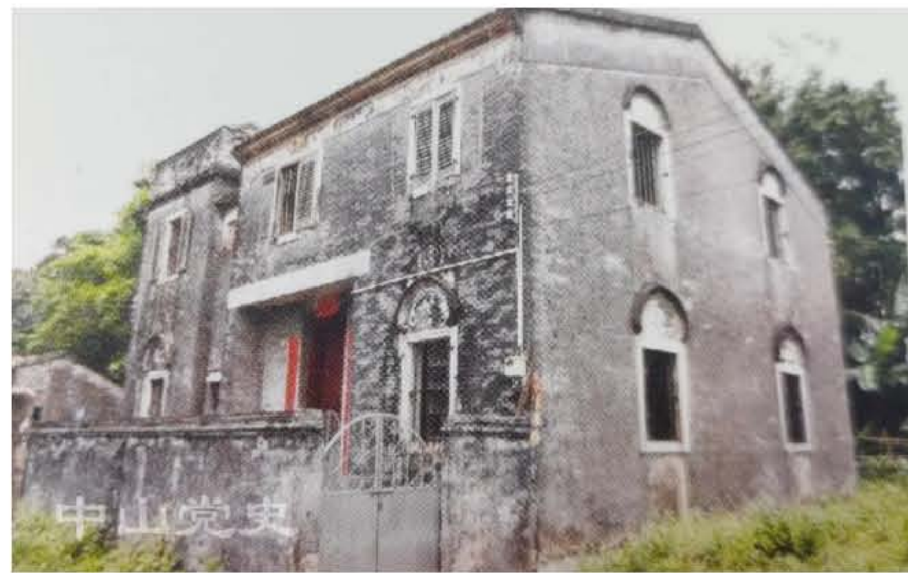
位于石门村的中山人民抗日义勇大队部旧址。

1943年12月31日，在义勇大队成立前夕，南番中顺游击区指挥部精心布置了一场袭击南朗伪军据点的战斗。南朗是岐关公路东线、五桂山外围的一个重镇，是游击队外出活动的主要通道之一。南朗安定村后山的安定学校内有一座两层的钢筋混凝土结构的楼房，四面陡坡，地势险要，是控制南朗镇的制高点。1943年冬，敌伪军经五桂山区抗日游击队的连续打击后深感威胁，于是伪军第四十三师师长彭济华从石岐调来一个营进驻南朗，安定学校作为伪军控制五桂山区的据点。伪军四十三师一二八团三营黄光亚部共有官兵230多人，配备精锐装备，还配有轻重机枪12挺、掷弹筒6具。该部在营房四周挖有弯曲的交通壕，修筑了地堡；学校外边还有木桩、铁丝网等障碍物；门口设了两个岗哨，有哨兵日夜巡逻，警戒森严。这据点被彭济华吹嘘为“攻不破的金汤”。