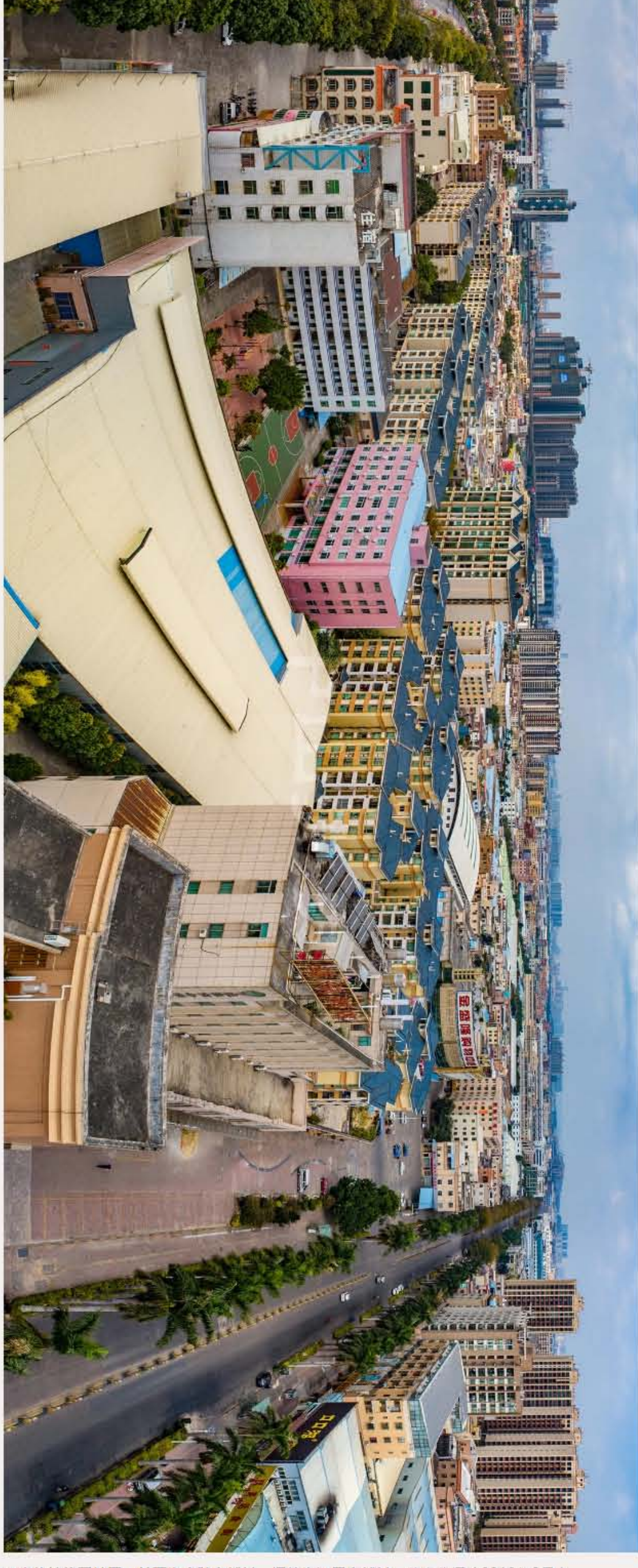
▲南头镇将军社区，前面为合胜自然村，远处为河尾自然村。（2019年2月）