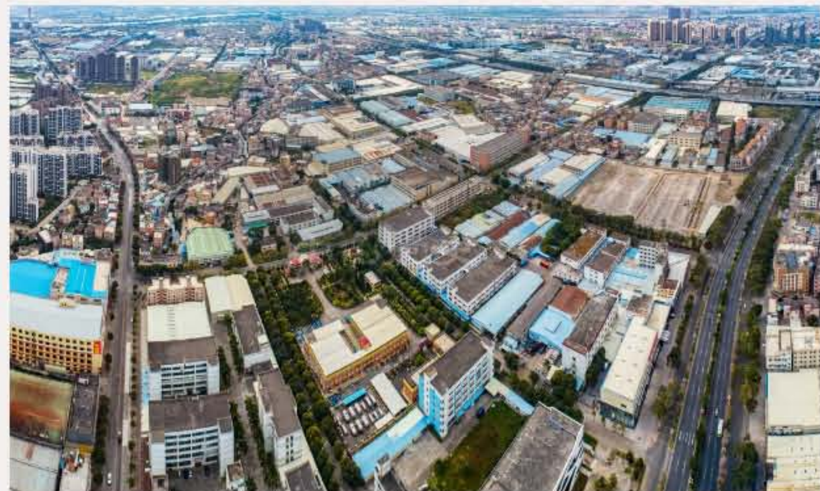
▲南头镇浔心社区二坊（右）、石坎（左）自然村。黄春华摄（2019年2月）

清道光年间（1821—1850），梁、冯等姓族人陆续从广东顺德迁居该地开垦形成村落。由于种植产量较高，得名益耕围，村随围名称益耕村，曾用名浔心大队第七、第八生产队。世居村民主要为梁姓、冯姓以及罗姓。特色农产品有甘蔗、香蕉、桂花鱼等。20世纪90年代，东福南路逐步形成食街，2012年被规划为南头镇特色美食街，极大地促进了该村经济的发展。