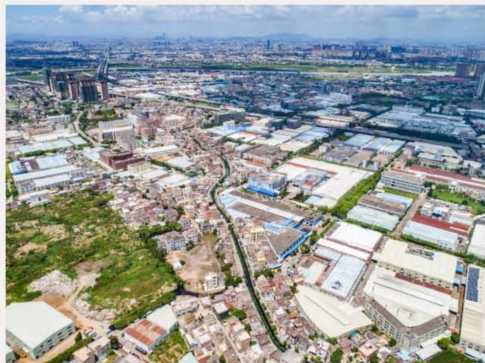
▲南头镇浔心社区细缙自然村。（2020年7月）