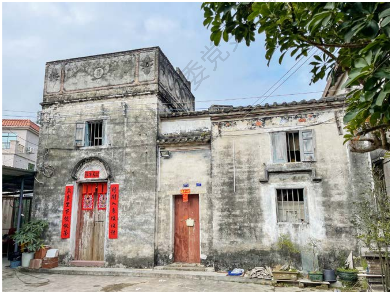
中山抗日游击大队暨抗日民主政权中山县行政督导处机关旧址正面（黄春华摄于2022年2月）

中顺中心县委做出发展中山、开辟五桂山抗日根据地的决定。1942年春，中心县委先后派欧初、卫国尧、谭桂明等人带队到五桂山区开辟抗日根据地。同年5月，中山抗日游击大队成立后，该楼房成为中山抗日游击大队队部。1944年春，南番中顺游击区指