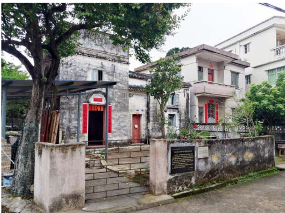
中山抗日游击大队暨抗日民主政权中山县行政督导处机关旧址周边全景

挥部根据中共中央的指示，结合珠江地区敌后抗日游击战争的实际，做出《关于政权工作的决定》，并以中山五桂山区为珠江地区的先行点，首先建立起抗日民主政权。同年4月18日—21日，五桂山区军民各界建政代表大会在石莹桥村召开，选举产生区一级民主政权五桂山区战时联乡办事处。七八月间，五桂山区、谷镇区、滨海区先后成立乡、区民主政府。10月，抗日民主政权中山县行政督导处成立，其办公地址设于此，代号为“岳阳楼”。中山抗日民主政权成立后，认真贯彻执行党的抗日民族统一战线政策，实施党的抗日民主十大纲领，在支援部队抗日的同时，积极开展地方的政治、