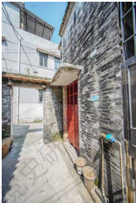
黄石生故居外门（左）和房屋侧面