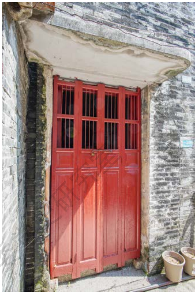
黄石生故居正门特写

该故居于2012年1月被中山市人民政府公布为中山市不可移动文物；2008年6月被中共中山市委核定公布为中山市革命遗址，并作为中共中山市委党史教育基地。