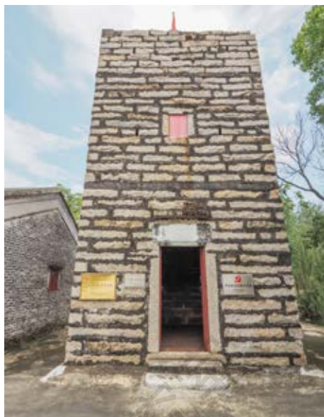
青岗升旗楼——中山县第一、二区武工队成立旧址正面