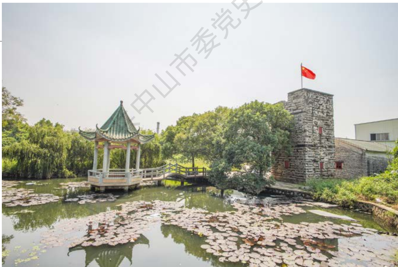
青岗升旗楼——中山县第一、二区武工队成立旧址背面周边全景