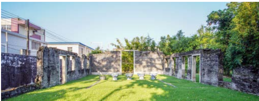
兼善杨公祠遗址——中共南方局军事委员会和肃反委员会联络点遗址内部全景