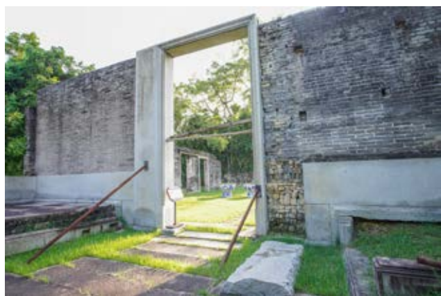
兼善杨公祠遗址——中共南方局军事委员会和肃反委员会联络点遗址门口