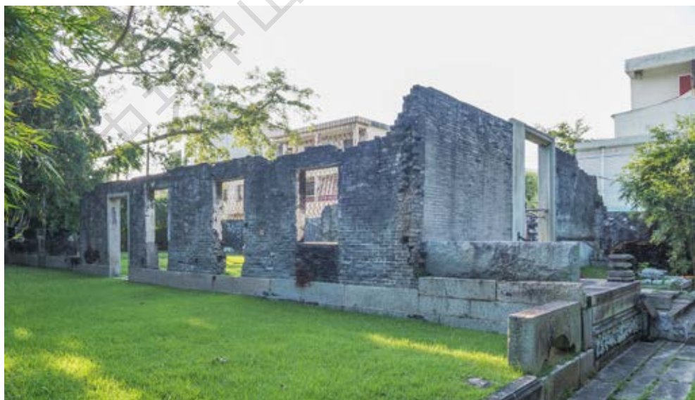
兼善杨公祠遗址——中共南方局军事委员会和肃反委员会联络点遗址侧面

连、李甫、梁纯义和转移回翠亨的陆枝等一批中山籍的广州铁路工人，都以此为联络点。杨殷还在翠亨村家中的柴房里筑了一道夹墙，以作掩护。八七会议后，中共中央和中共广东省委开始策划在广州举行武装起义。同年 11 月，广东省委依照中央指示，准备举行广州起义，由张太雷、叶挺、恽代英、周文雍、杨殷、叶剑英、聂荣臻等担任起义领导。杨殷负责参谋团工作，协同叶挺负责军事指挥，并同周文雍一起领导和组织工人赤卫队。同月 28 日，广东省委发表《号召暴动宣言》，号召民众“准备为广州苏维埃而战争”。组织者之一的杨殷通过