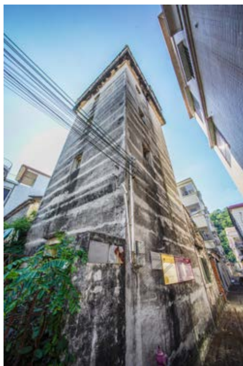
江尾头长堤街十七巷 5 号碉楼——中共中山县委第二次武装工作会议旧址背侧面（黄春华摄于 2020 年 10 月）

该旧址建于民国时期，碉楼坐西北向东南，钢筋混凝土结构，面阔 4.3 米，纵深 4.5 米，楼高 4 层，约 14 米，占地面积约 19 平方米。该碉楼具有中山近代华侨建筑特色，于 2012 年 1 月被中山市人民政府核定公布为中山市不可移动文物。