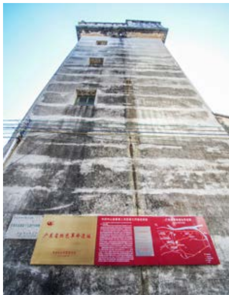
江尾头长堤街十七巷5号碉楼——中共中山县委第二次武装工作会议旧址侧面外景