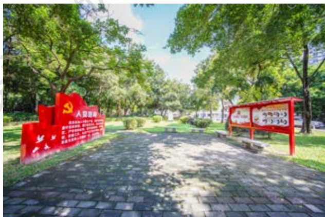
卖蔗埔起义遗址主题纪念公园

余各路农军得此情况而退回原地，后化整为零，转入分散隐蔽活动。战斗持续两个小时，农军伤亡数十人，四区农军中队长廖桂生在突围时英勇牺牲，不少被捕的农军当场被枪杀。