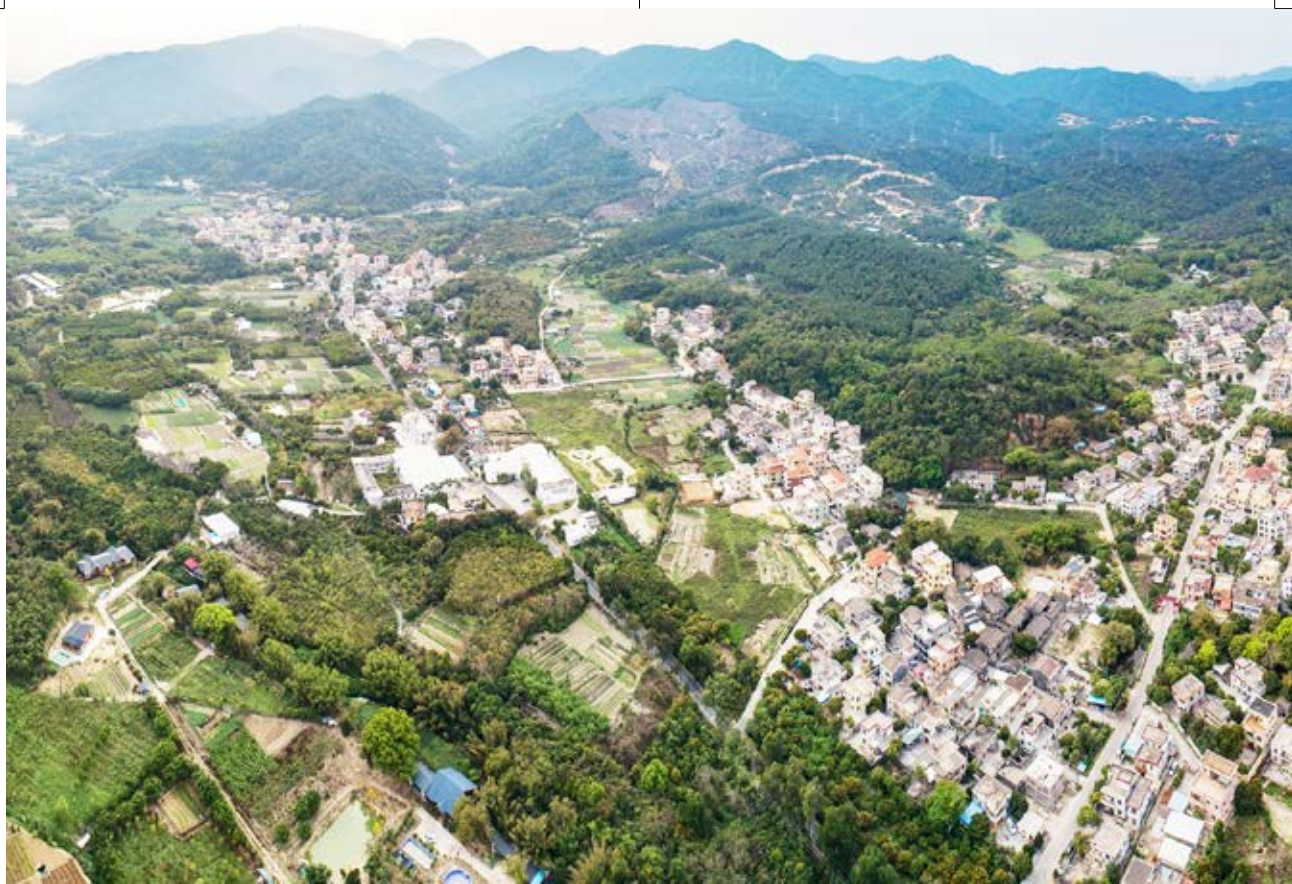
粉碎日军“四路围攻”战场遗址之一位于南朗街道翠亨村石门片区山间