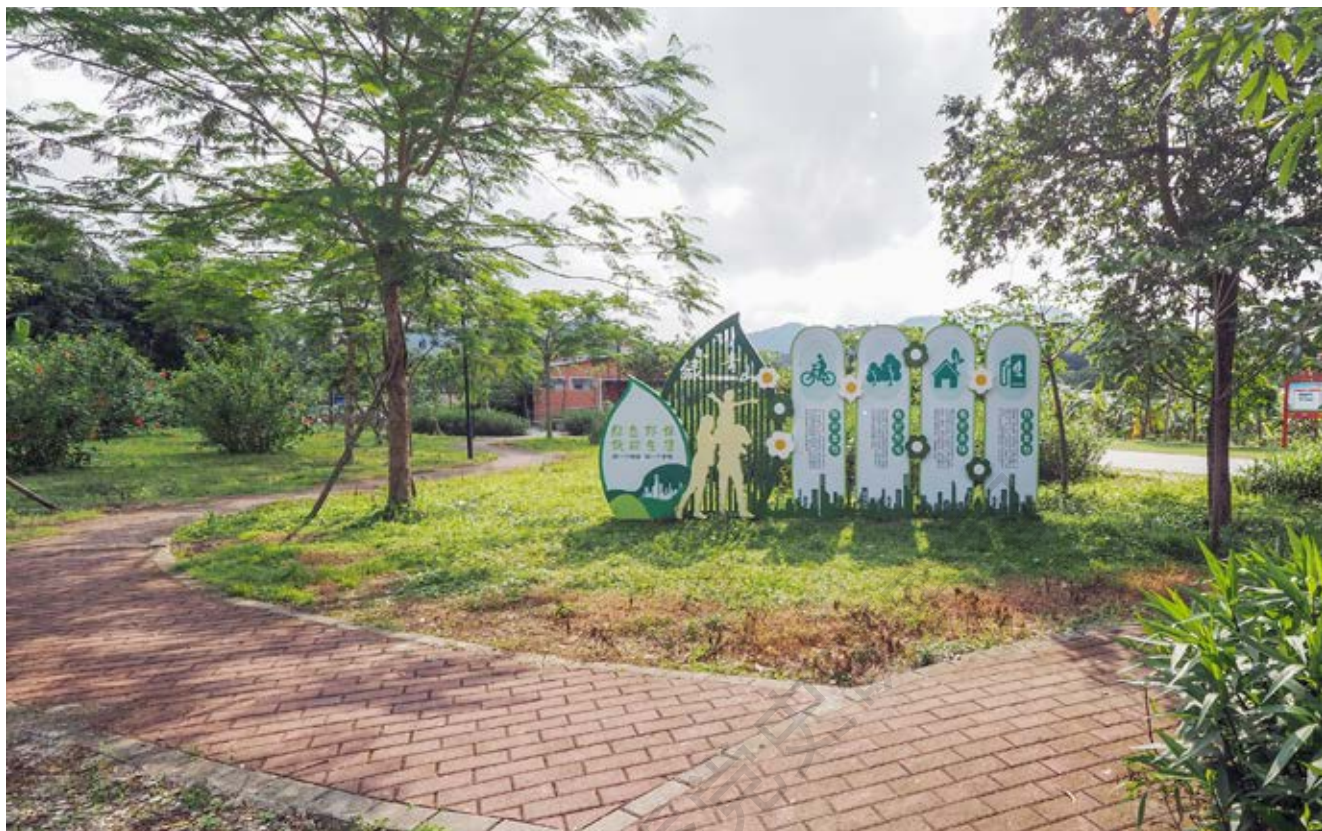
粉碎日军“四路围攻”战场遗址，图为翠亨美术馆周边公园一角

的作战计划。由于大批学习班人员转移，敌人很快就得到了消息，加强了进攻石门一路的兵力。南番中顺游击区指挥部派义勇大队的仲恺队、黄蜂队及连排、班排训练班学员130多兵力，组成四组分别抢占4个制高点，严阵以待。