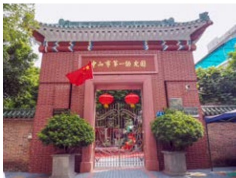
中共中山县工作委员会成立旧址所在地中山市机关第一幼儿园正门外景

该旧址于2012年1月被中山市人民政府公布为中山市不可移动文物，2019年11月被中山市人民政府核定公布为中山市文物保护单位；2006年6月被中共中山市委核定公布为中山市革命遗址，并作为中共中山市委党史教育基地。