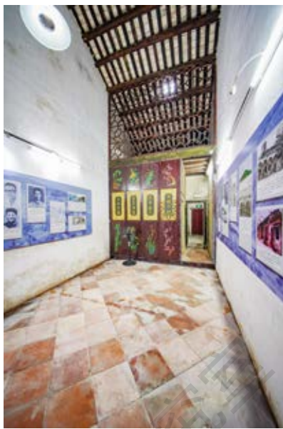
黄健故居内部展览一角 (黄春华摄于 2021 年 11 月)