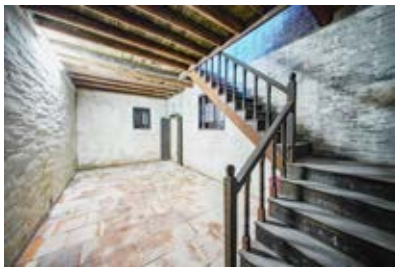
黄健故居内部楼梯间