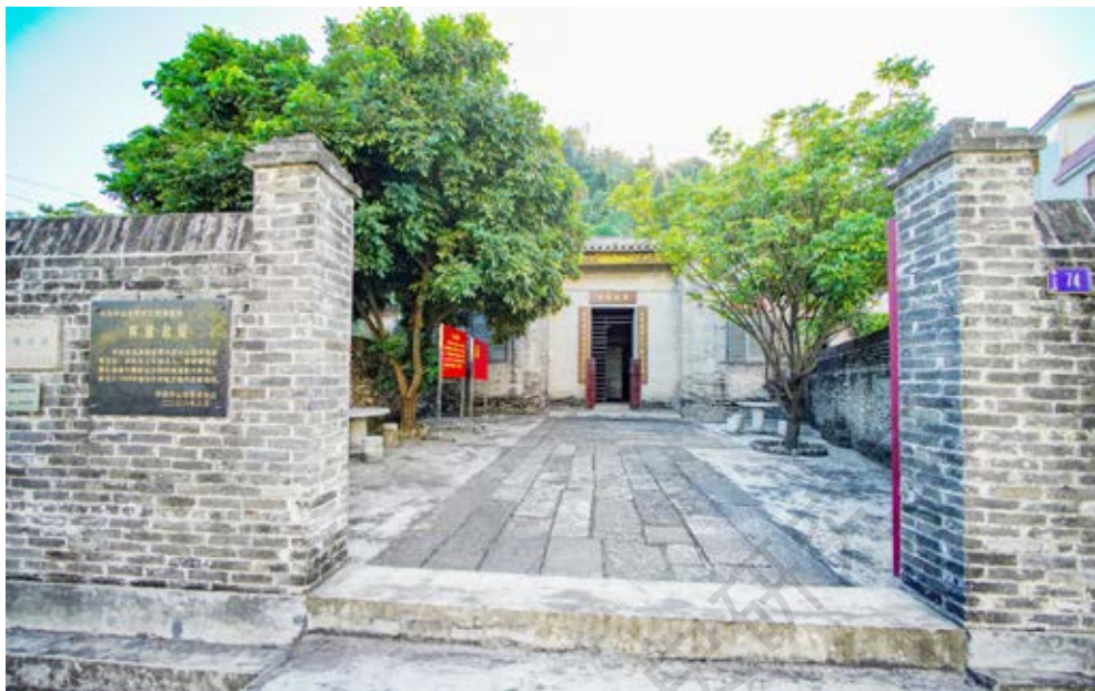
黄健故居外景