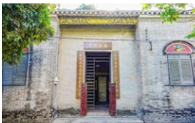
黄健故居门口特写