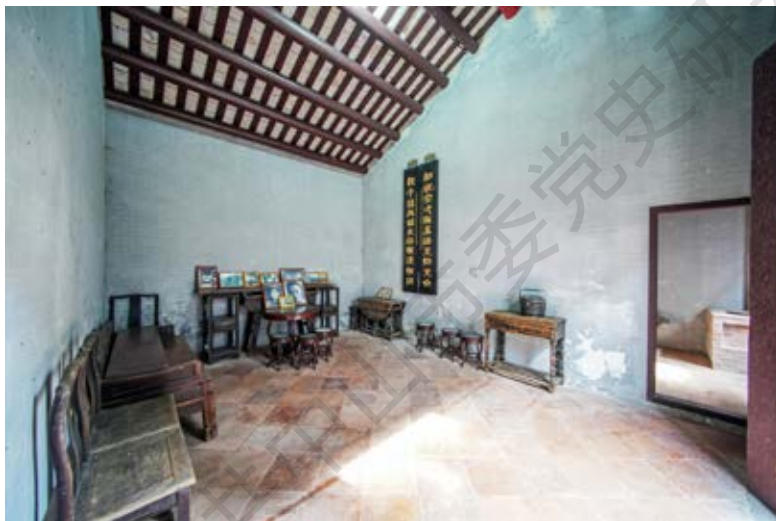
中共左步村支部活动旧址室内大厅全景

先后任中山抗日游击大队、中山人民抗日义勇大队大队长，中区纵队第一支队、珠江纵队第一支队支队长。