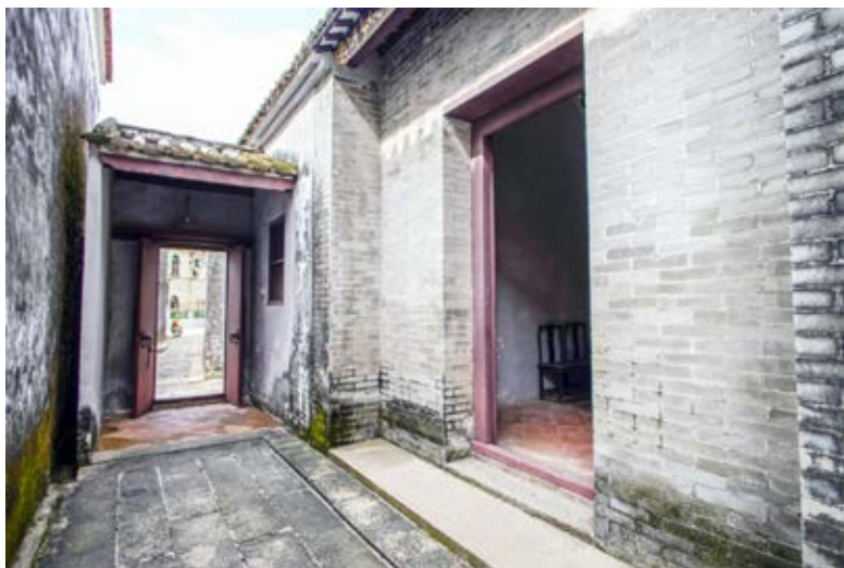
中共左步村支部活动旧址院内一角（于2020年10月）