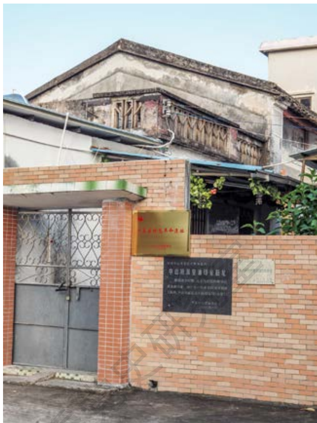
中共中山特派室油印室 旧址围院正门（黄春华摄于 2020年10月）