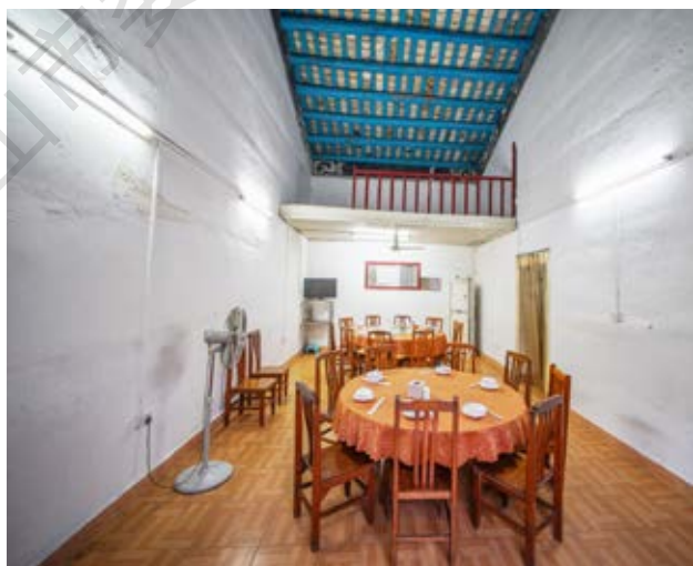
中共中山特派室油印室旧 址内景

该旧址于2012年1月被中山市人民政府核定公布为中山市不可移动文物；2008年6月被中共中山市委核定公布为中山市革命遗址，并作为中共中山市委党史教育基地。