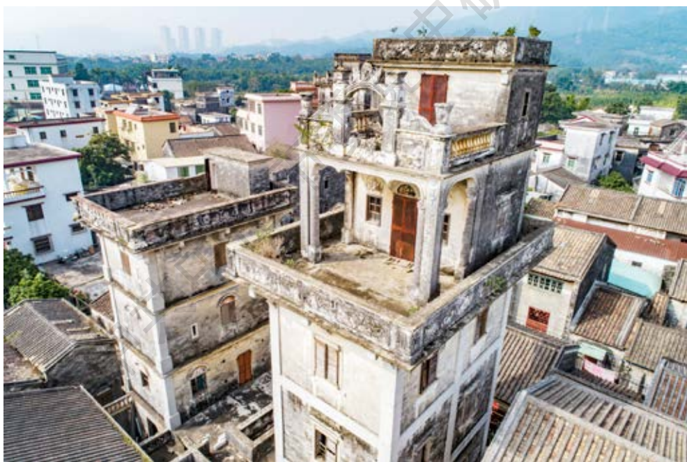
白石防御战指挥碉楼旧址（右边碉楼）俯瞰图

面阔4.6米，纵深7.3米，高6层，约21米，建筑占地面积约34平方米。其具有中山近代华侨建筑的特色。