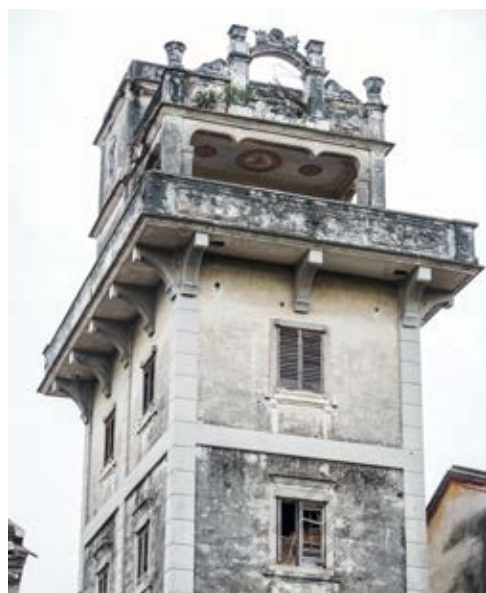
白石防御战指挥碉楼旧址正面外景（左）及侧面上部特写（黄春华摄于2020年10月）