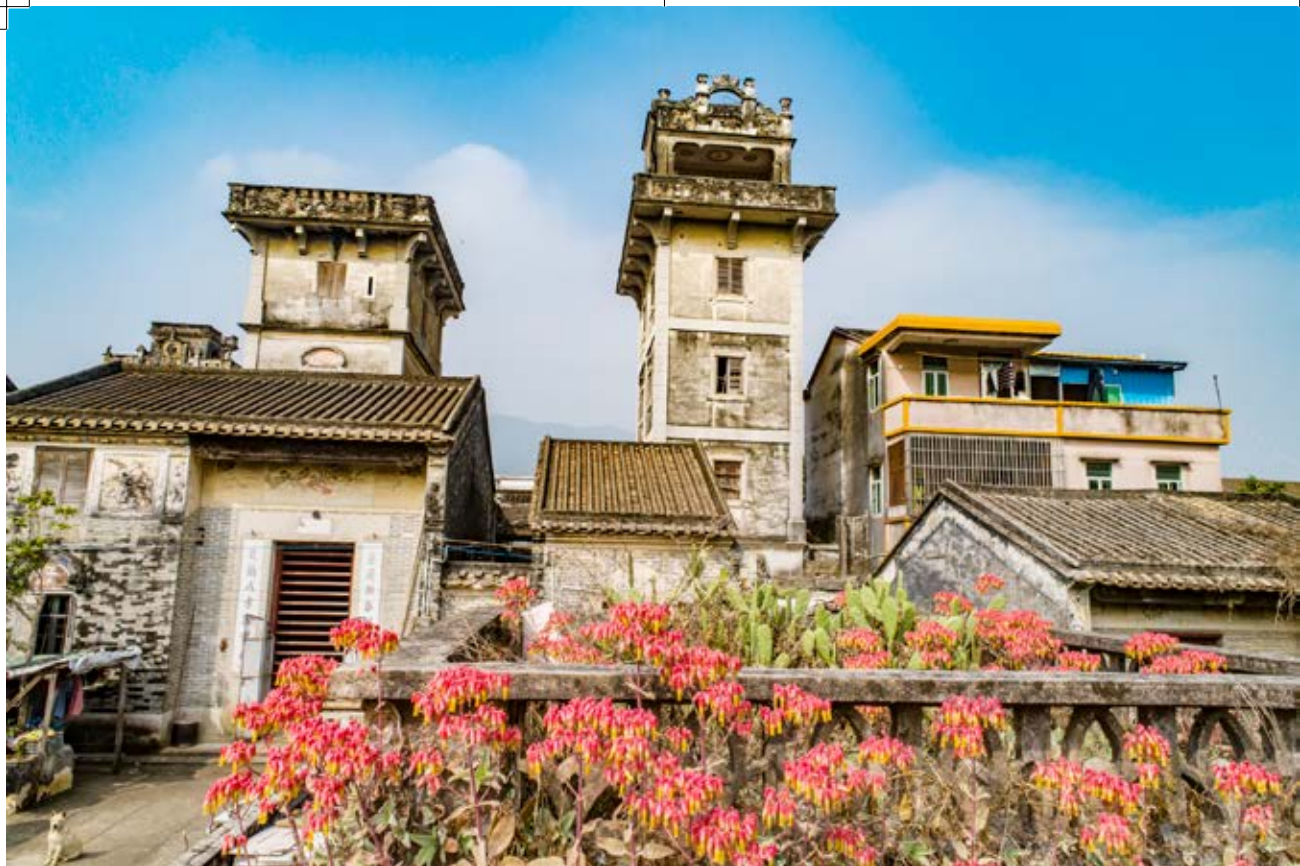
白石防御战指挥碉楼旧址（右边碉楼）周边全景（黄春华摄于2019年1月）