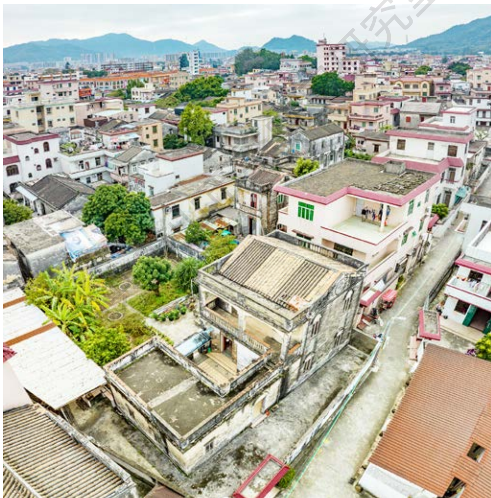
中共南番中顺临时工作委员会妇女干部训练班旧址（图中近处）和周边全景航拍图（黄春华摄于2023年1月）

根据地。为此，临工委妇女委员谭本基向指挥部和临工委提出要把培训骨干作为开展抗日根据地妇女工作重点的建议获准。1943年5月至1944年初，妇女干部培训班在五桂山区和四、五、八区先后办了5期、6个班，每期2—3个月，每班都有二三十人参加，共