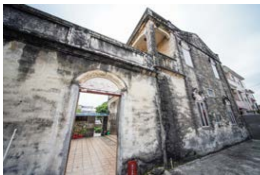
中共南番中顺临时工作委员会妇女干部训练班旧址侧面外景（黄春华摄于 2023 年 1 月）