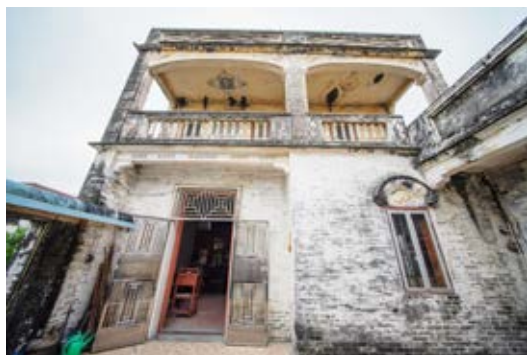
中共南番中顺临时工作委员会妇女干部训练班旧址主屋正门外景（黄春华摄于 2023 年 1 月）

该旧址于 2012 年 1 月被中山市人民政府核定公布为中山市不可移动文物；2008 年 6 月被中共中山市委核定公布为中山市革命遗址，并作为中共中山市委党史教育基地。