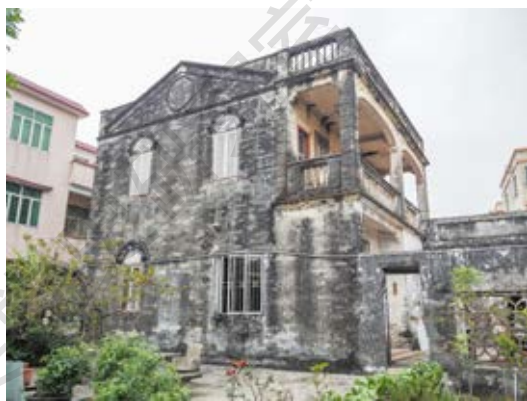
中共南番中顺临时工作委员会妇女干部训练班旧址主屋侧面外景（黄春华摄于 2023 年 1 月）