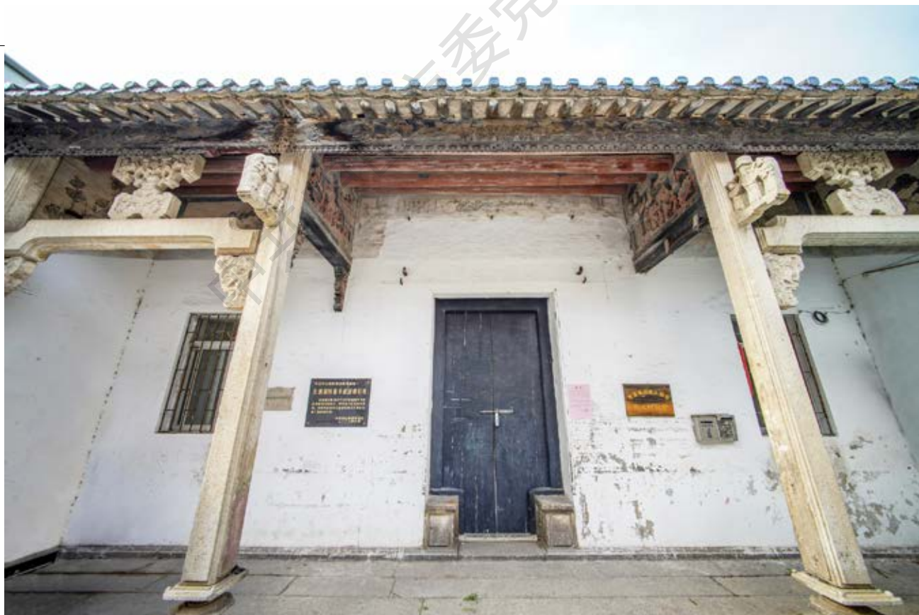
长洲战时服务团团部旧址正面

长洲战时服务团设团部于长洲隐士祠，其十分活跃，主要做三方面的工作：一是开展抗日宣传，发动民众参加抗日，及时把抗战前线的消息通报给村民，并教村民唱抗日歌曲。二是发动村中青年参加战时服务团。中