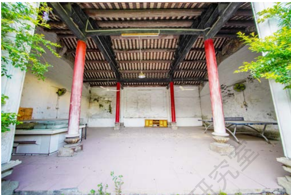
长洲战时服务团团部旧址内景

山县抗日先锋队成立后，长洲战时服务团随之改为抗先组织，当时长洲各村参加抗先的青年男女有300多人。三是组织村民支援前线，慰劳守土杀敌的将士。该服务团常在村中及县城石岐，甚至沙涌、深湾等地演出抗日进步话剧和演唱抗日歌曲，还组织团员们写慰问信和宣传材料，交国民党中山县党部代寄给抗日前线的战士。长洲战时服务团及后来的长洲抗先队