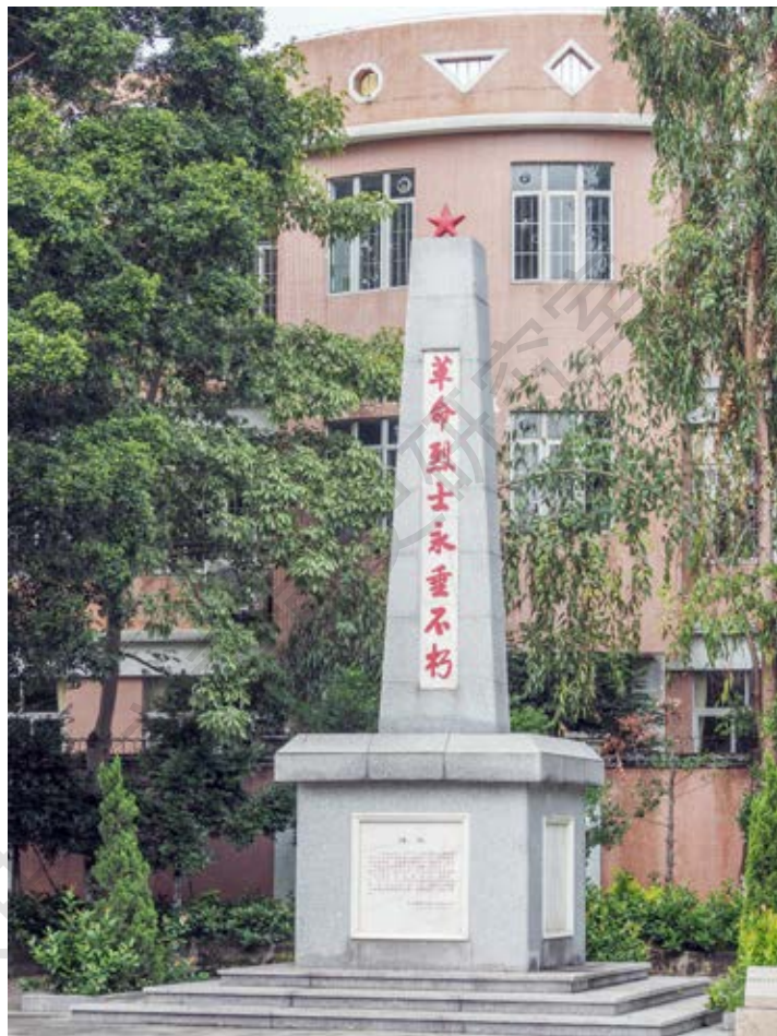
民众革命烈士纪念碑正面（黄春华摄于2020年10月）

该纪念碑坐西北向东南，建于1992年8月，由青砖砌成，外表以水泥砂浆覆盖，整体形状为梯形，高7.8米，面积约17平方米。碑身镶大理石，阴刻“革命烈士永垂不朽”字样，碑顶有一红五角星。碑座为正方形，边