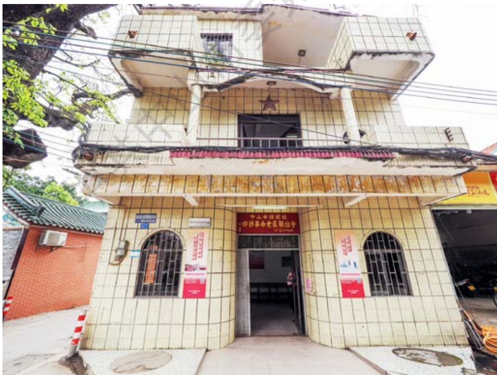
四沙革命活动交通站遗址现为四沙革命老区联谊会，图为其正面外景（黄春华摄于2023年4月）

1948年夏，三区部分武装负责人在小榄镇第九街1号召开武装工作会议。会议决定在沙田区建立武工队。