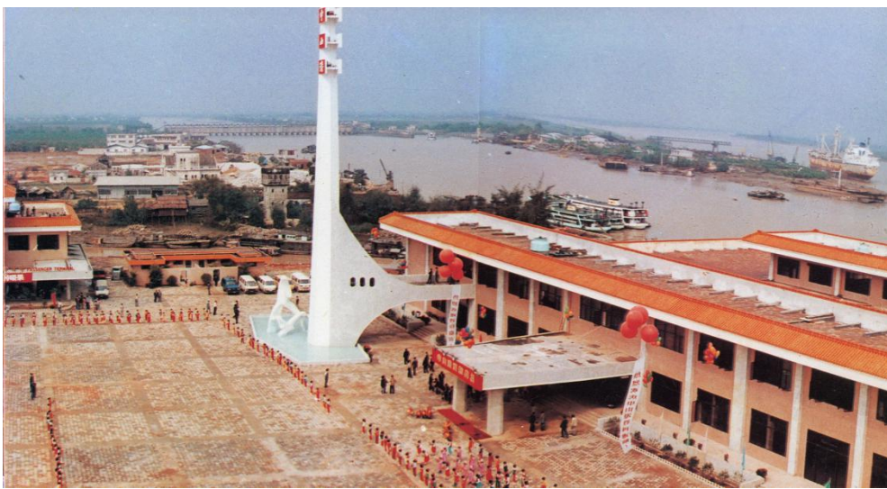
中国对外开放口岸之一——中山港全景

1983 年 3 月，广东省航运厅与中山县委、县政府联合向广东省委、省政府提交《关于再次请示开设横门口岸与香港直通客运航线的报告》，10 月，县政府向省政府呈送《关于将“横门新港区”改名为“中山港”的报告》；11 月，省政府同意改名，并于次月向国务院呈送《关于把中山港辟为对外开放口岸的请示报告》。1984 年 5 月，国务院同意开辟中山港至香港国轮客运航线；次年 2 月 9 日，中山港至香港客轮航线开通。看着时间进度就能感觉到当年的只争朝夕。