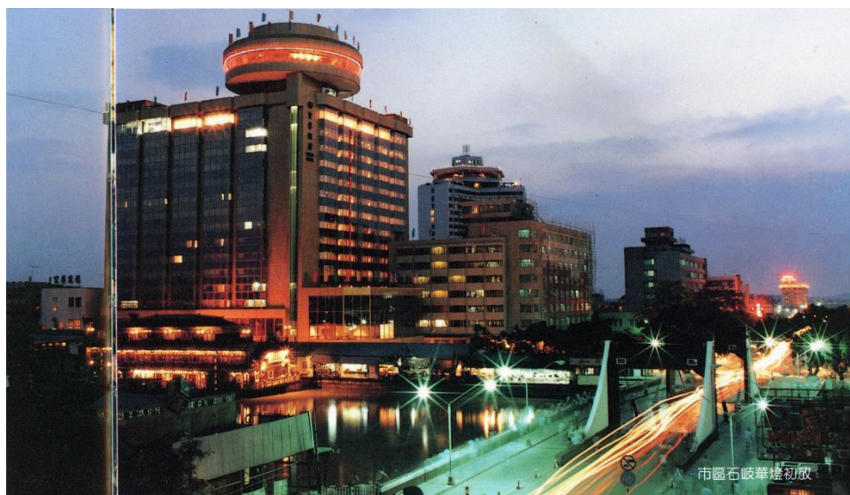
中山富华酒店

随着中山旅游业的兴旺繁荣、外经外贸业务的拓展，以及改革开放后返乡港澳同胞、侨胞的增多，一批现代化酒店如雨后春笋般建设起来。至1984年，已经开业的高档宾馆有中山温泉宾馆、华侨大厦二期（即今富华酒店副楼）、中山大厦（现已拆除重建，在国际酒店东北侧）、石岐宾馆（现为万业酒店）和西郊宾馆（后更名为铁城酒店、宜必思酒店）。正在兴建的大型宾馆有：中山国际酒店、富华酒店、中山酒店（位于今香山酒店旁，现已拆除）、长江宾馆（即后来的怡景假日酒店）、翠亨宾馆（翠亨大道旁，孙中山故居对面）、京华酒店（已拆除重建，名字继续沿用）以及扩建中的菊城酒店。特别是中山国际酒店和富华酒店，直线距离仅为200米，且顶层都设置了旋转餐厅，港澳媒体称这或许是一项吉尼斯世界纪录。