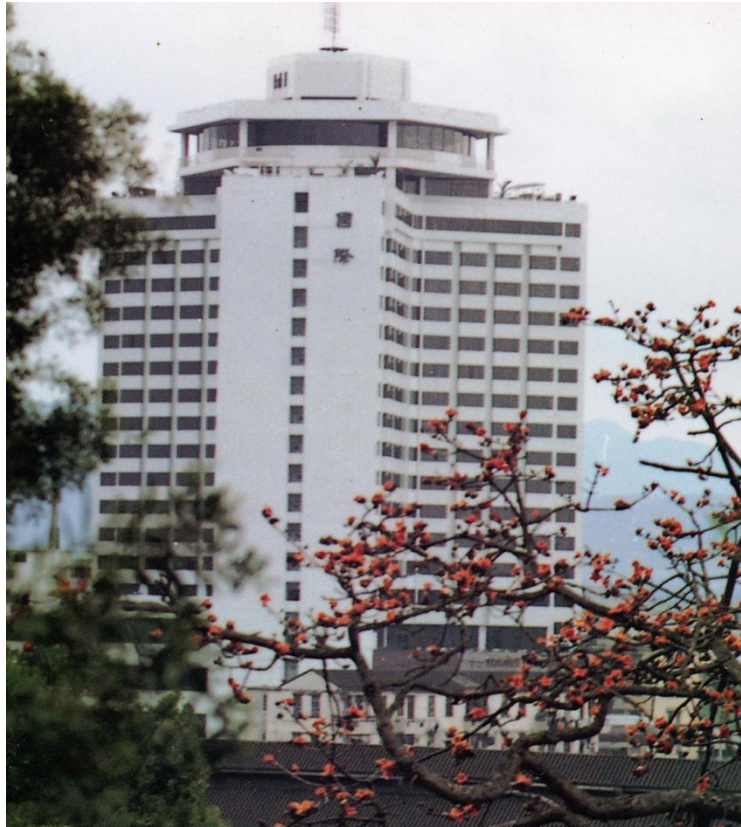
中山国际酒店外景