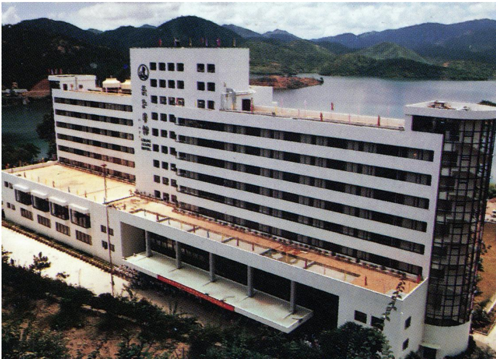
长江宾馆 图片来源：《中山》（1986）画册