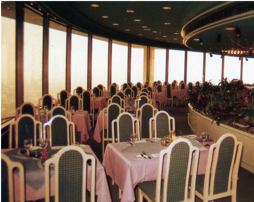
当年中山的旋转餐厅内景