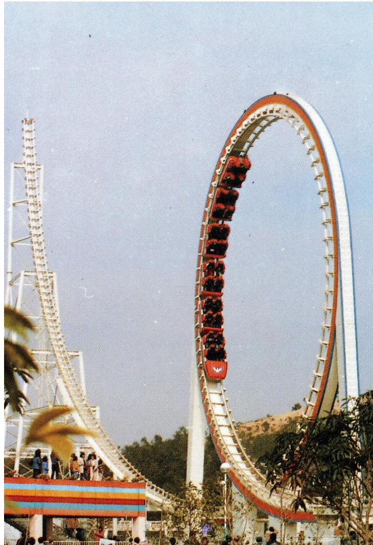
长江乐园的翻滚飞车