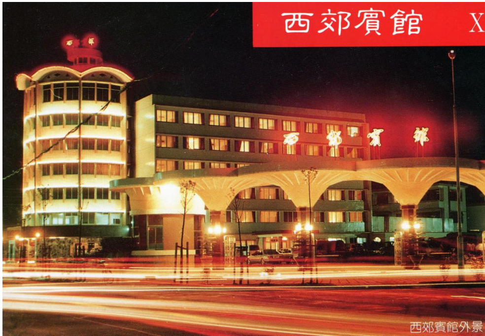
西郊宾馆外景