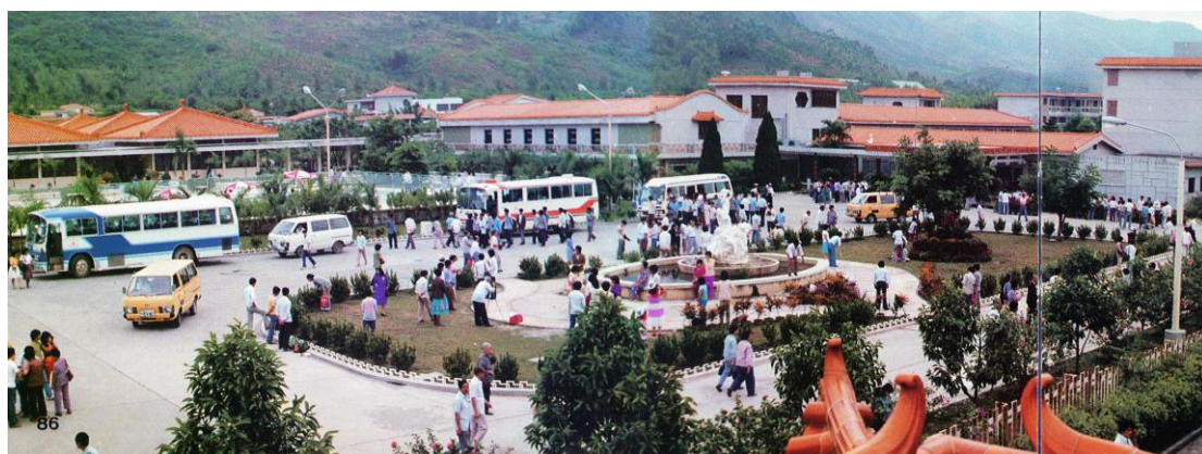
中山温泉宾馆

当年，中山大刀阔斧地改革开放、引进外资，是从发展旅游事业起步的。从1978年10月成立“建设中山温泉指挥部”，到1979年7月县委对霍英东、何贤等港澳知名人士提出的协议反馈修改意见，到8月广东省对外经济技术联络办公室批复，再到11月27日举行动工仪式，1980年12月28日竣工开业，“前无古人”的中山温泉宾馆项目从决策到完成审批流程用了不到一年，而建设也只用了一年。港澳人士对这个速度的评价是，不仅在港澳，就是在世界上也是少见的。仅1981年1月10日到4月中旬这3个月里，住宿者就达1万多人次；到此旅游的港澳同胞、侨胞约15万人次；总收入约合人民币100万元，纯利约14万元。 1 此后，1983年7月15日中山长江乐园迅速建成开业，开全国先河，轰动粤港澳，引发一股追捧热潮。