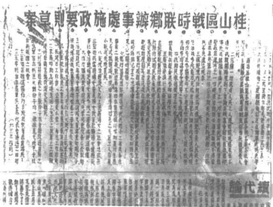
五桂山区抗日民主政权文献