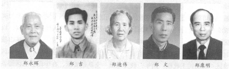
谷镇区政务委员会部分成员