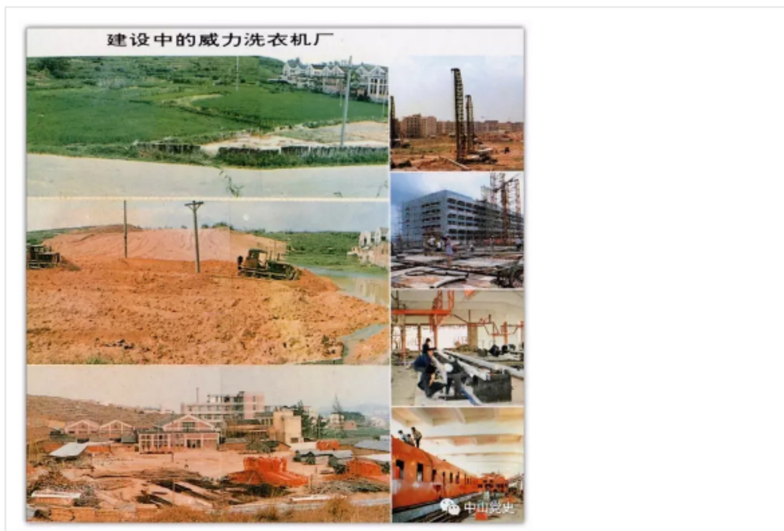
1984年中山洗衣机厂在柏山建设厂房，老企业脱胎换骨，闯出了生机勃勃之路。

1983—1984年为上规模、促发展阶段 ，一批先行者勇于尝鲜引进先进的设备，让老企业脱胎换骨，闯出了生机勃勃之路；