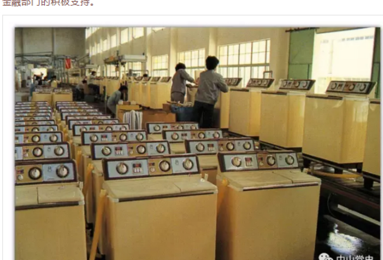
威力洗衣机的成功鼓舞了一批中山老企业大胆实行改造，上马新项目，开拓新市场。

包括政策、技术、资金等方面的支持。当时，企业看准了的新项目，基本都能得到市领导与主管部门、金融部门的积极支持。