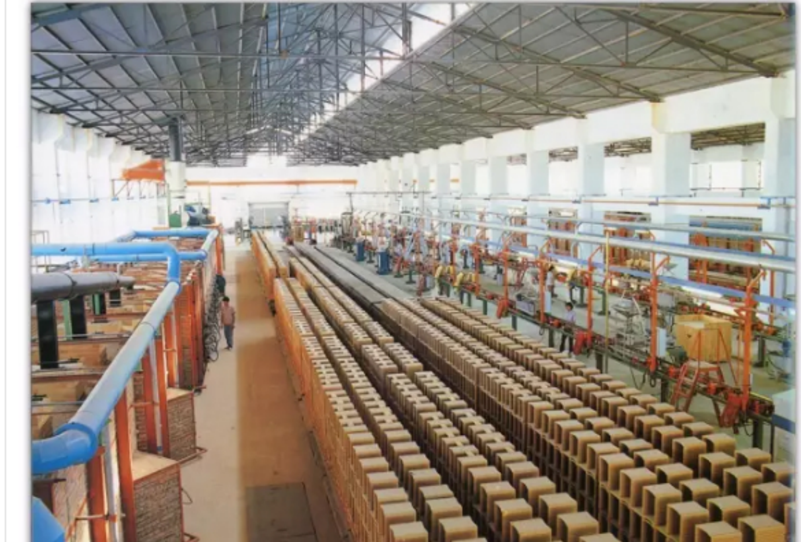
1985年，中山海能总厂从意大利引进的彩棉地毯生产线，生产的毯面就在1987年全国同行业质量评比中荣获第一名。

1985—1988年为全面转型阶段 ，也是中山市属工业技改、扩规的密集期。大批市属国有、集体企业和部分乡镇企业以市场需求为导向，引进成套或关键生产设备，爆发式地开发出竞争力强、具有特色的优势产品群，“中山货”锋芒渐露。1988年中山升格地级市从机制、体制上加快了这一进程。