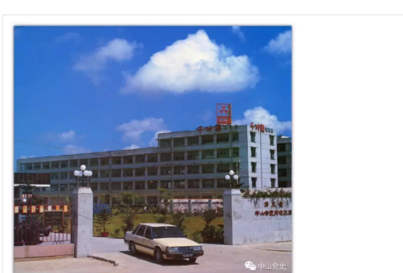
政府科学引导，中山的风能生产企业形成合力，实力大增。图为中山家用电器总厂外景。

指的是政府对工业发展的政策到位。从工交办到经济委员会，再到撤销经委下辖的工业局、二轻局，按行业成立了各行业工业公司，中山市属工业的管理架构依实际情况而科学调整，为新兴支柱产业崛起创造了条件。