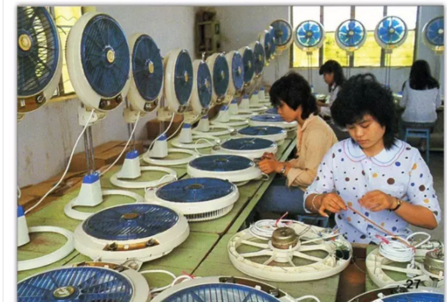
改革开放早期，借助国际产业转移之势，中山生产的电风扇畅销海外。

也刚好在这一时期翩然而至。一批发达国家和地区正在进行产业结构调整、产业转移；世界资本选择投资投资的余地缩小；新技术革命加速了技术设备的更新换代和转移；香港产品在国际市场的竞争能力加强，但又受到劳动力缺乏、工资增高的困扰。正在此时，中央于1979年允许广东的改革“先行一步”，实行“特殊政策、灵活措施”，于是，世界各方的产业转移、资本转移找到了理想的出路。