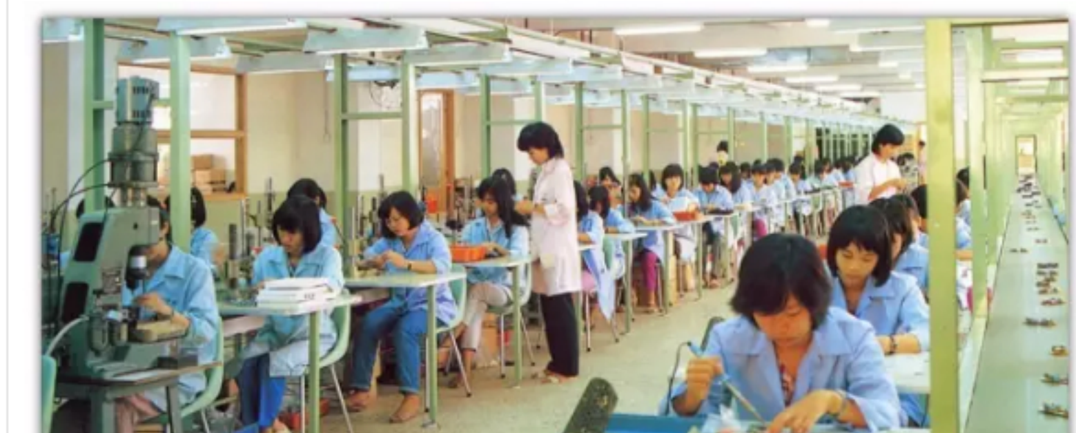
1978年9月，中山已开始接受“三来一补”装配电子产品，为电子产业的发展积累了经验。图为20世纪80年代的中山市无线电总厂。

1979—1982年为起步阶段 ，企业通过在“三来一补”合作中学习消化港澳信息，了解国际市场情况，吸收技术精髓和管理经验，工业结构从支农型向轻工型、消费型转变；