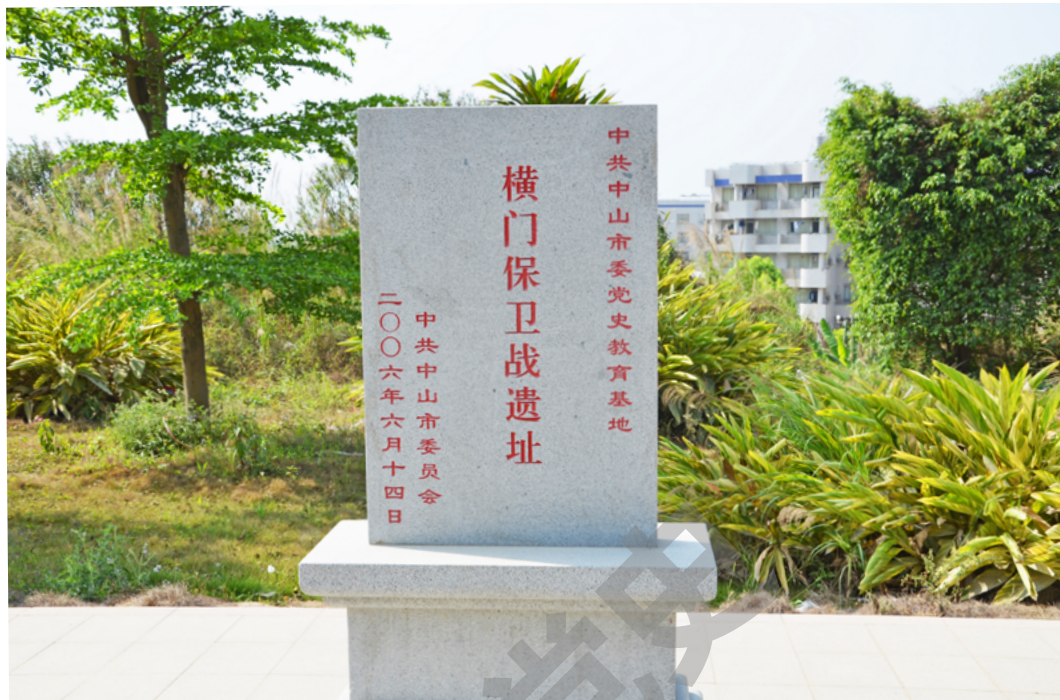
横门保卫战纪念碑

都产生了影响。为了表示纪念，2010年中共中山市委修建了这座横门保卫战遗址纪念碑。你们看，因为有了四周的苍松和翠柏，整个遗址更加庄严肃穆。”