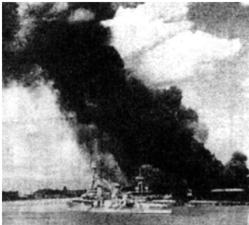
玻璃围日舰触雷沉没